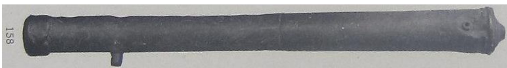
8) № 158. Гармата човенного типу (у музеї відсутня). Чавунний сплав; лиття. L – 110 см. Калібр – 37 мм. Без дельфінів, одна цапфа відбита. Знайдена поблизу с. Прохорівка Переяславського повіту. З колекції В. Тарновського – № 158.