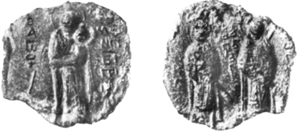
Мал. 7. Печатка з образами св. Симеона Богоприємця та святих мучеників Бориса та Гліба (за М. Ліхачовим).

У цьому контексті особливу увагу привертють спостереження М. Ліхачова щодо можливих шляхів визначення належності печатки з образом св. Симеона Богоприємця на одному боці й святих мучеників Бориса та Гліба на другому (мал. 7). Дослідник ставив запитання, чи не чернігівському князеві Всеволоду Симеону із запису Любецького синодика вона належить? І що означають слова літопису про поховання князя Ігоря Ольговича в київському монастирі Св. Симеона «бѣ бо манастырь ѿца его . и дѣда егъ Стослава»? 85