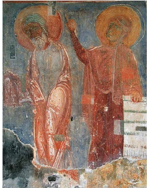
Мал. 4. Композиція «Стрітєння» зі Спасо-Преображенської церкви Польцька (за В. Сараб'яновим).

Для подібної за топографією 71 та сюжетністю фрески «Стрітєння» Спасо-Преображенської церкви Євфросиніївського монастиря (мал. 4), на думку В. Сараб'янова, характерне символічне приєднання до храмового вівтаря, що поєднує позачасовий символізм зображення з конкретністю богослужіння в храмі. Також він зауважував, що тема Спасіння людства є визначальною в іконографії сюжету 72 . Усе це можна сказати й про фреску київської пам'ятки, але з акцентом на персональне довгождане Спасіння 73 святого старця Симеона Богоприємця.