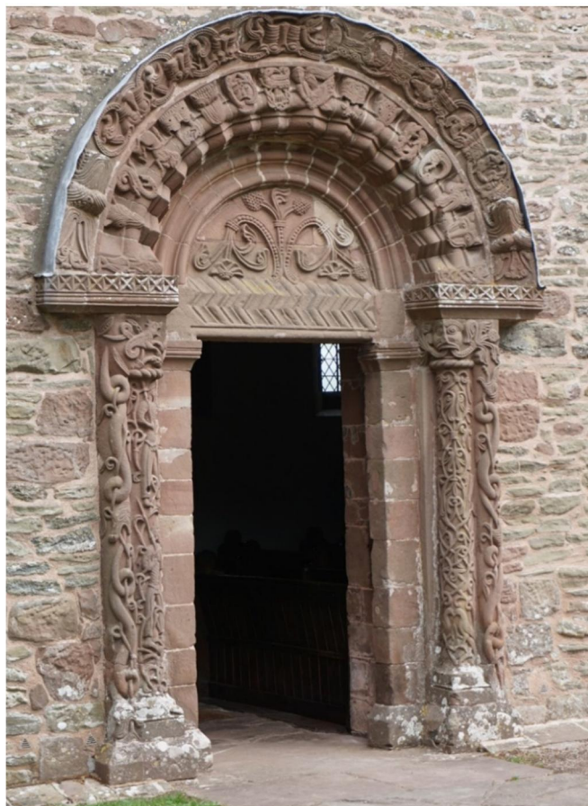
Мал. 8. Південний портал церкви св. Марії та св. Давіда, Килпек (Херфонишур, Англія). XI ст.