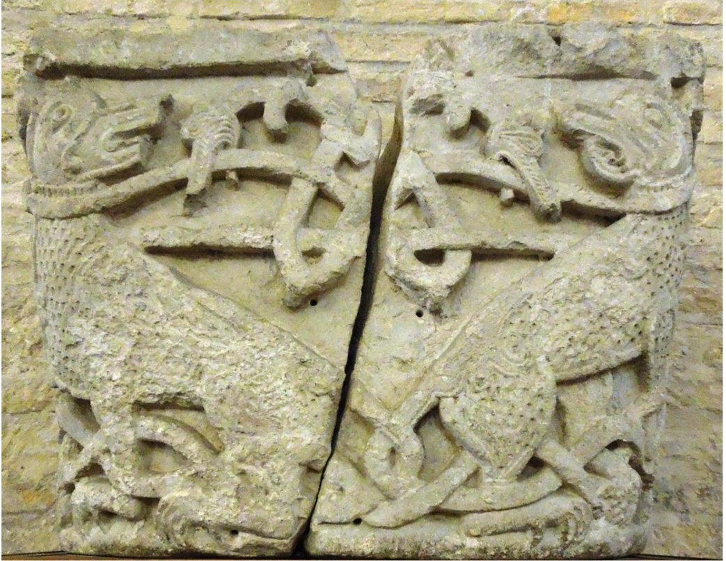
Мал. 3. Капітель із зображенням тварин з Борисоглібського собору.

значити, що всі знайдені у Борисоглібському соборі різьблені архітектурні блоки мали сильне поверхнєве забруднення та втрати. Капітель із зображенням звірів (мал. 3) виявився розколотою на кілька фрагментів унаслідок (як вважав М. Холостенко) падіння з висоти 18 . Напевно, на момент відновлення собору домініканцями всі ці різьблені камені знаходились у розвалах стін.