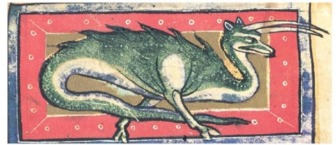
Мал. 5. Грифоподібні та драконоподібні істоти з англійського «Бестиарію» кінця XII ст. (за факсимільним виданням під ред. К. Муратової).