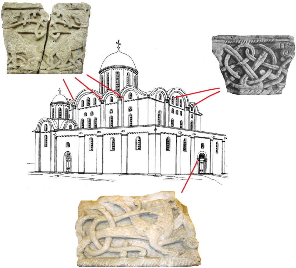
Мал. 4. Схема розміщення білокам'яних рельєфів на фасадах Борисоглібського собору відповідно до реконструкції М. Холостенка.

Вивчення місць давніх копалень засвідчує, що під час видобутку каменю з моноліту породи вирізали блоки різноманітної форми, відповідно до майбутнього призначення. Остаточна їх обробка відбувалася згодом на будівельному майданчику. Така технологія є в цілому характерною для Середньовіччя (наприклад, у Східній Європі вона практикувалася під час видобутку пірофілітового сланцю на Волині 28 ).