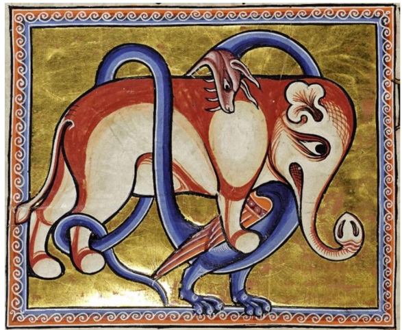
Мал. 6. Звірі, пантера та дракон. Мініатюра Рочестерського «Бестиарію» другої чверті XIII ст. (Британська бібліотека, Royal MS 12 F XIII, f. 9).