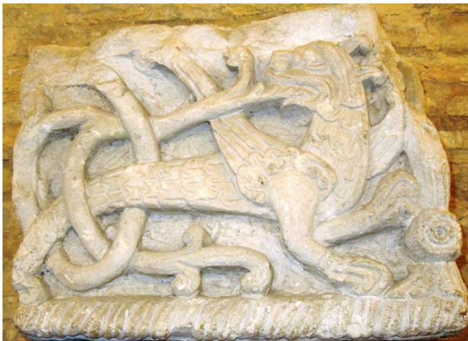
Мал. 1. Кутовий камінь із зображенням фантастичного звіра. Борисоглібський собор у Чернігові.

У 1948 р. під час досліджень Борисоглібського собору поч. XII ст. в Чернігові було знайдено різьблений архітектурний блок із вапняку з рельєфними зображеннями птаха та фантастичного звіра у плетиві (мал. 1). Ця знахідка одразу привернула до себе увагу завдяки художній досконалості виконання та незвичності для регіону Північного Лівобережжя.