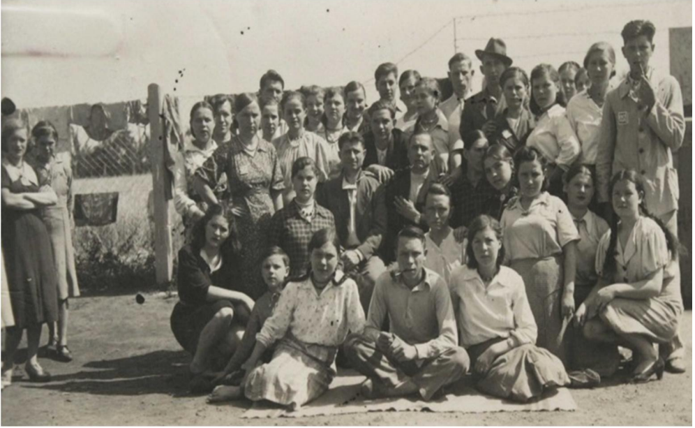
Фото 4. Група робітників у таборі.