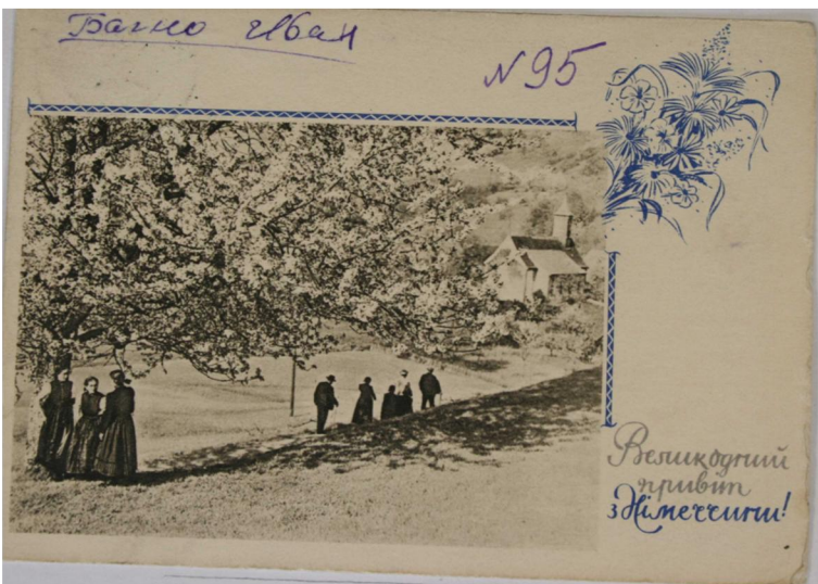
Фото 5–6. Типові листівки остарбайтерів.