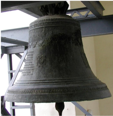
Дзвін «Мазепа». 1705 р.