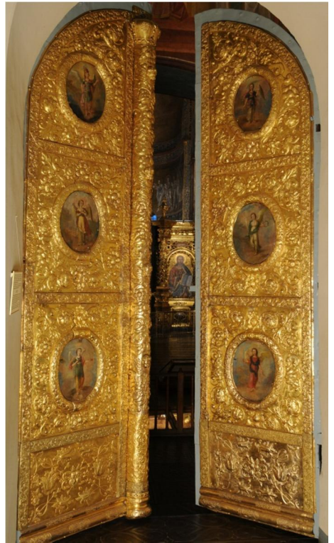
Вхідні врата Софійського собору. Початок XVIII ст.

Сучасники називали софійську дзвіницю прижиттєвим пам'ятником Івану Мазепі, а самого мецената – «новим Володимиром». Він був глибоко віруючою людиною й багаторічним ктиторм Церкви – у перекладі з грецької це слово означає особливо щедрого жертводавця, людину, яка заснувала, побудувала, відремонтувала чи обдарувала храм, є його світським настоятелем. У цьому гетьман Мазепа наслідував своїх державних попередників – великих київських князів. У 1690–1707 рр. за ктиторства Мазепи було здійснено капітальний ремонт собору – надбудовано другі поверхи галерей, над якими встановлено шість нових грушоподібних куполів, оновлено верхи старих веж. Собор засяяв золотом куполів і білизною стін. У перебудову