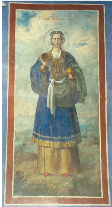
Свята княгиня Ольга, олійний живопис, капела Івана Мазепи. XVIII ст.

українка Мазепиних часів, по-жіночому чепурна й витончена, навіть кокетна. Вона струнка, гарна й духовно велична, з маленькою голівкою на довгій шії. Княгиня наче тягнеться до небес, а її пасок нагадує Богородичний. Це – символіка Богородиці Світлопріємної Св'яті, притаманна акафістному образу Цариці Небесної, покровительки цариці (княгині) земної. Замість традиційного хреста або храму Ольга, як і св. Марія Магдалина, граціозно здійсмає золотий дзбанок з миром, що символізує духовне зцілення, дароване святою княгинею від Бога людям. Але водночас княгиня владна, в її погляді бачимо силу правительки та глибину внутрішнього переконання в правоті віри. Це – позначений рисами західно-європейського мистецтва, створений добою Мазепи суто київський тип святої Ольги, зовсім не характерний московському. А відтак в образах Володимир та Ольга відбилася як життєва, так і символічна паралель з гетьманом Мазепою та його матір'ю Марією Магдалиною Мазепиною, яка була впливовою релігійною діячкою, ігуменею дівочого аристократичного Вознесенського монастиря на Печерську.