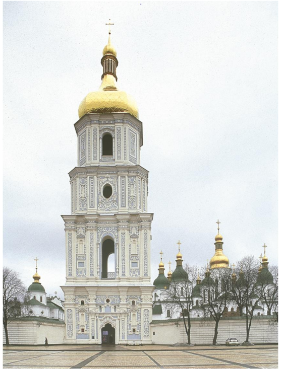
Дзвіниця з боку Софійського майдану. 1699–1706 рр.

Початок некрополю Софії Київської поклав мармуровий шеститонний саркофаг Ярослава Мудрого, який став знаменитою реліквією собору. Він віддавна стоїть у Володимирському вівтарі, створеному за митрополита Петра Могили у східній частині північної внутрішньої відкритої галереї. За нашими дослідженнями, Ярослав створив у Софії свою усипальню, як і всі давні володарі, на самому початку свого правління. У 1019 р. він прийшов з Новгороду й заволодів Києвом після перемоги над братами в міжусобиці, яка спалахнула в 1015 р. після смерті їхнього батька Володимира. Собор, закладений Володимиром у 1011 р., уже стояв у майже завершеному стані, на долю ж Ярослава випало лише закінчення цієї великої справи батька в 1018/19 р. Вбудова Ярославом у відкриту галерею усипальні вельми виразно простежується в архітектурі й стінописі Софії. Відтак усипальня Ярослава, за універсальною традицією, стала головним атрибутом його влади в Києві як нового правителя. Усю славу творця і власника Софії літописці та будівничі Ярослава приписали лише йому одному. Звісно, на його замовлення. Адже побудова ним усипальні означала вічність влади його династії в Київській державі та претензію Ярослава на посмертну канонізацію, для чого необхідною була наявність потужного князя. Так бувало у світовій історії 2 .