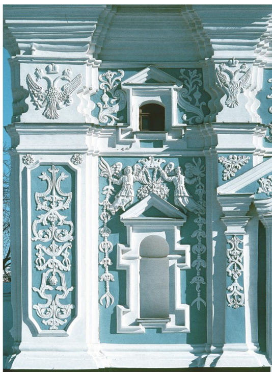
Софійська дзвіниця, вигляд з подвір'я, 1-й ярус. 1706 р.

Відомий український історик Сергій Павленко слушно зазначає, що Іван Мазепа виводив свій рід від Рюриковичів з полоцької гілки князів Бабичів Друцьких 13 . Ця вельми розгалужена княжа лінія походила від Ізяслава Володимировича (пом. 1001 р.), старшого сина Володимира Святого 14 . На нашу думку, як нащадок Володимира, гетьман, якого сучасники називали «новим Володимиром», звісно, не просто для «красного слівця», на початку свого правління отримав від Петра I, який покладався на підтримку Мазепи, спеціальний дозвіл на влаштування в Софії власної усипальні. Бо здавна правителі влаштовували свої усипальні при зайнятті престолу – це світова універсальна традиція. Так само вчинив до Мазепи його сучасник митрополит Гедеон Четвертинський, який також був з Рюриковичів, тому й заповів своє поховання біля гробниці Ярослава, що вочевидь теж було санкціоновано вищою світською та духовною владою Московії. Звісно, для перехоплення владної естафети у власні руки, бо, на задум Петра, над гетьманом мав стояти цар, а над Київським митрополитом – патріарх. Проте Мазепа мав інші розрахунки. Не випадковим є те, що на замовлення гетьмана в західну половину південної зовнішньої галереї була вбудована «капела Мазепи», де гетьман, а ніяк не московський цар, велично постає «новим Володимиром Київським», який був царем, що беззаперечно засвідчують його монети й печатки, на яких він фігурує в короні та мантиї.