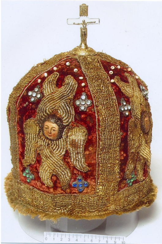
Митра Рафаїла Заборовського з його поховання. XVIII ст.

Відкриття дивовижного факту збереження мощів митрополита Рафаїла Заборовського, славетного київського чудотворця, важко переоцінити. Сталося чудо явлення святих останків людини, яка стільки зробила для Православної Церкви України та Києва, подарувавши нам його архітектурне обличчя. У 2022 р. була створена комісія з канонізації митрополита. 28 березня 2023 р. рішенням Священного Синоду Православної Церкви України Рафаїл Заборовський піднесений до лику святих. Наразі мощі митрополита Рафаїла відкрито шануються в Трапезній церкві Софійського монастиря, освяченій ПЦУ на честь святого князя Ярослава Мудрого.