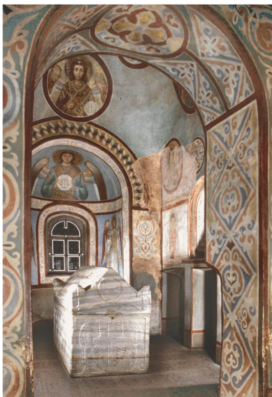
Саркофаг Ярослава Мудрого в Софійському соборі.

Так само і в Константинополі патріархів ховали не в Софійському соборі, а в другому за значенням храмі Св. Апостолів Петра і Павла, наступниками яких завжди вважали вищих церковних ієрархів. Тобто і Київські митрополити спершу мали власну усипальню у храмі Св. Апостолів, а в Софії першим поховали великого князя Ярослава, бо усипальня засновника собору Володимира була влаштована ним при побудові Десятинної церкви. А потім 40 років князів у Софії не ховали, адже на це вочевидь була заборона.