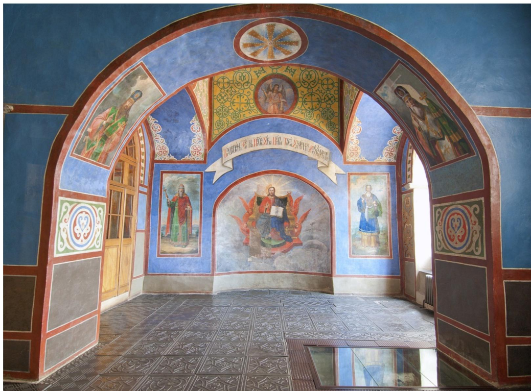
Капела Івана Мазепи в Софійському соборі. Початок XVIII ст.

ваному в стилі козацького бароко Софійському соборі вже за Мазепи розпочався новий розпис, який так само ніс оптимістичну ідею. За гетьманування Мазепи на місці зруйнованої західної зовнішньої відкритої галереї створено розкішно оформлений головний вхід. Від нього збереглися мідні позолочені рельєфні двері, прикрашені іконами в овальних медальйонах із зображеннями архангелів. Цей сяючий золотим блиском і яскравими фарбами чудовий витвір ювелірного мистецтва було виконано київськими майстрами.