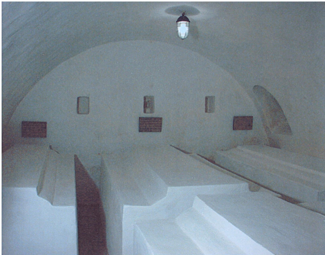
Митрополичий склеп у Софійському соборі. Кінець XVII – початок XVIII ст.

ді писаря Іакова про смерть і погребіння митрополита Рафаїла жодним словом не говориться про те, що цей розкішний склеп створений на його замовлення! І це при тому, що Іаков детально перелічив усі благодіяння цього митрополита в Софійському соборі й монастирі. Про що це свідчить? Виявляється, за три роки до того, 29 серпня – 12 вересня 1744 р. в Києві перебувала цариця Єлизавета Петрівна, яка 10 вересня відвідала Софійський монастир, побувала на вечері в митрополичих покоях вельми шанобливого й велеречивого щодо неї Рафаїла та багато обдарувала Свято-Софійський собор і самого митрополита. На моє припущення, саме тоді «розторопний» (як називає його Іаков) митрополит Рафаїл, який, звісно, вже думав про місце свого вічного упокоєння, бо був вельми недужим, виклопотав дозвіл цариці Єлизавети на поховання в Мазепиному склепі себе та своїх наступників на кафедрі.