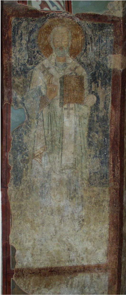
Свт. Микола. Фреска XI ст. над похованням Кирила II.

Цей вичищений з історії України за імперських часів факт поховання в Софії Сильвестра Косова багато про що говорить. Обидва митрополити були знайомими в Україні церковними і культурними діячами, високоосвіченими людьми, тому названі гетьмани покладали на них особливі надії щодо розбудови Гетьманщини. Косов походив із білоруської православної шляхти гербу «Корчак» на Вітебщині, отримав хорошу західну освіту і був «західником». А Гедеон, князь Святополк Четвертинський, був «східняком» з українсько-білоруської родини, вів свій рід з X ст. від князя Святослава Ігоровича й поріднився з попередником Мазепи гетьманом Іваном Самойловичем, був його сватом. У липні 1685 р. Гедеон був поставлений Московію Київським митрополитом, вийшов із підпорядкування Константинопольському патріархату та визнав верховенство патріарха Московського. Косов мав проукраїнську, а Гедеон – промосковську орієнтацію.