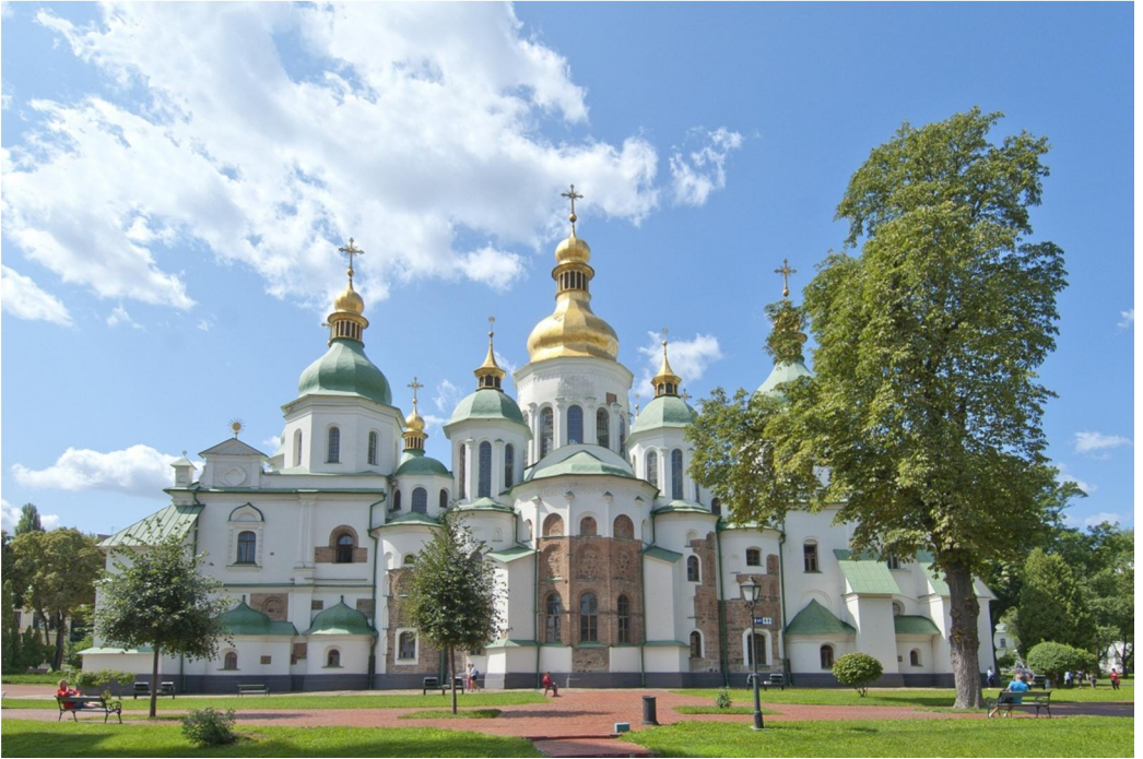
Софійський собор, східний фасад. Сучасний вигляд.

Прикметне, що склеп гетьмана був органічно вписаний в оновлений ним грандіозний ансамбль Софії як «тріумфальної церкви Премудрості Божої на святих київських горах», в якій акцентовано шляхетний родовід Мазепи і харизматичний характер його влади. Так впливає з «Тези на честь Івана Мазепи» 15 . До Софії вела Мазепина тріумфальна дзвіниця, яка донині формує давній образ Святого Києва. Вона багато оздоблена рослинним орнаментом, у мереживо якого вплетені фігури ширяючих ангелів у вигляді українських парубків у жупанах. Над ними – двоголові орли як візантійські символи митрополичої влади у злагоді із владою гетьмана. Це – архітектурний образ квітучої суверенної Гетьманщини, значимості її духовних і світських очільників та всього українського народу в історії.