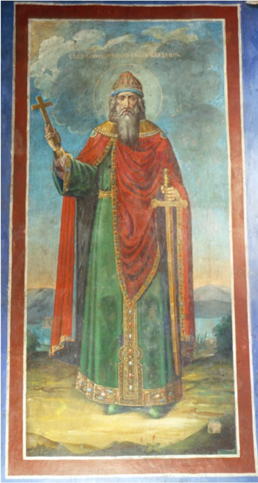
Князь Володимир Святий, олійний живопис, капела Івана Мазепи. XVIII ст.