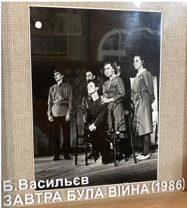
Фото 6. Сцена з вистави «Завтра була війна» 24 .

Колектив та його режисер здобули важливу перемогу, яка допомогла майбутньому становленню та розвитку Молодіжного театру в Чернігові. Після конкурсу колектив був на гастролях у Києві та Москві (3 квітня 1987 р.) 23 . Успіх першої вистави Молодіжної сцени надихнув колектив на створення наступної постановки, якою стала вистава «Завтра була війна» за повістю того ж Б. Васильєва.