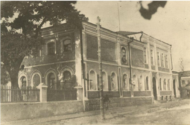
Фото 7. Будівля, де розміщується Чернігівський молодіжний театр. Фото 40-х рр. ХХ ст. 30