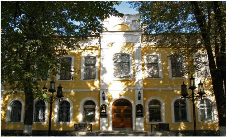
Фото 8. Приміщення Чернігівського молодіжного театру 45 .