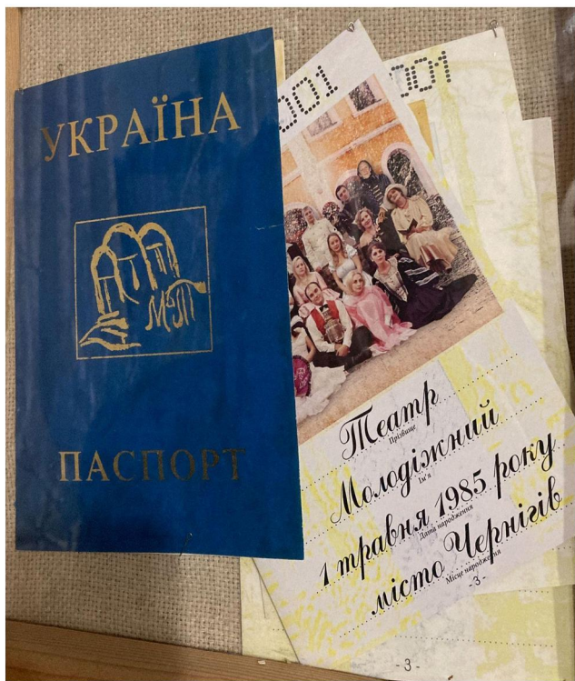
Фото 5. Паспорт «Молодіжного театру» 14 .