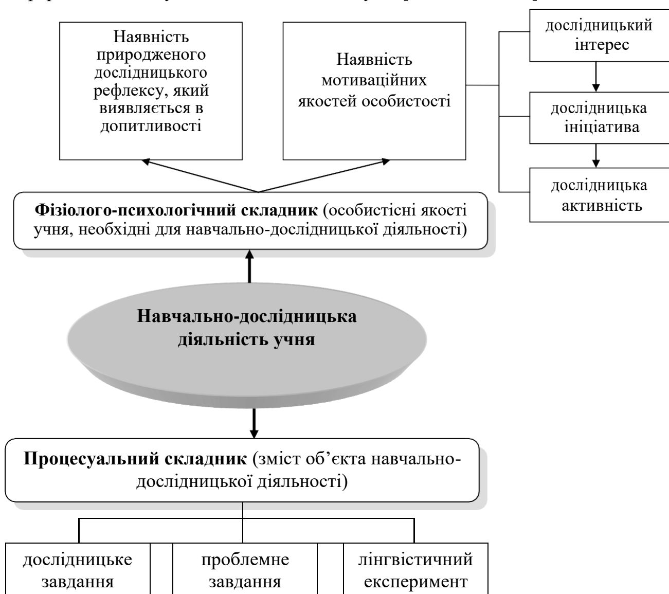
Рис. 2. Сутність навчально-дослідницької діяльності учня за діяльнісно-особистісного підходу в психології

Водночас психологи стверджують, що аналітичний і синтетичний типи мислення функціують завжди разом, взаємодоповнюють один одного й рівнозначно необхідні [14]. Проте один із типів може бути домінуючим. Зокрема, О. Савенков доводить, що дослідницькою діяльністю керує переважно права півкуля, а ліва півкуля відповідає за не менш важливу функцію в дослідницькій діяльності – оброблення інформації, отриманої під час дослідницького пошуку [15]. Отже, за висновками вчених-психологів, що ґрунтуються на експериментальних даних, дослідницька діяльність «здійснюється переважно правою півкулею, проте одержана в результаті інформація активізує діяльність і лівої півкулі» [Там само, с. 39].