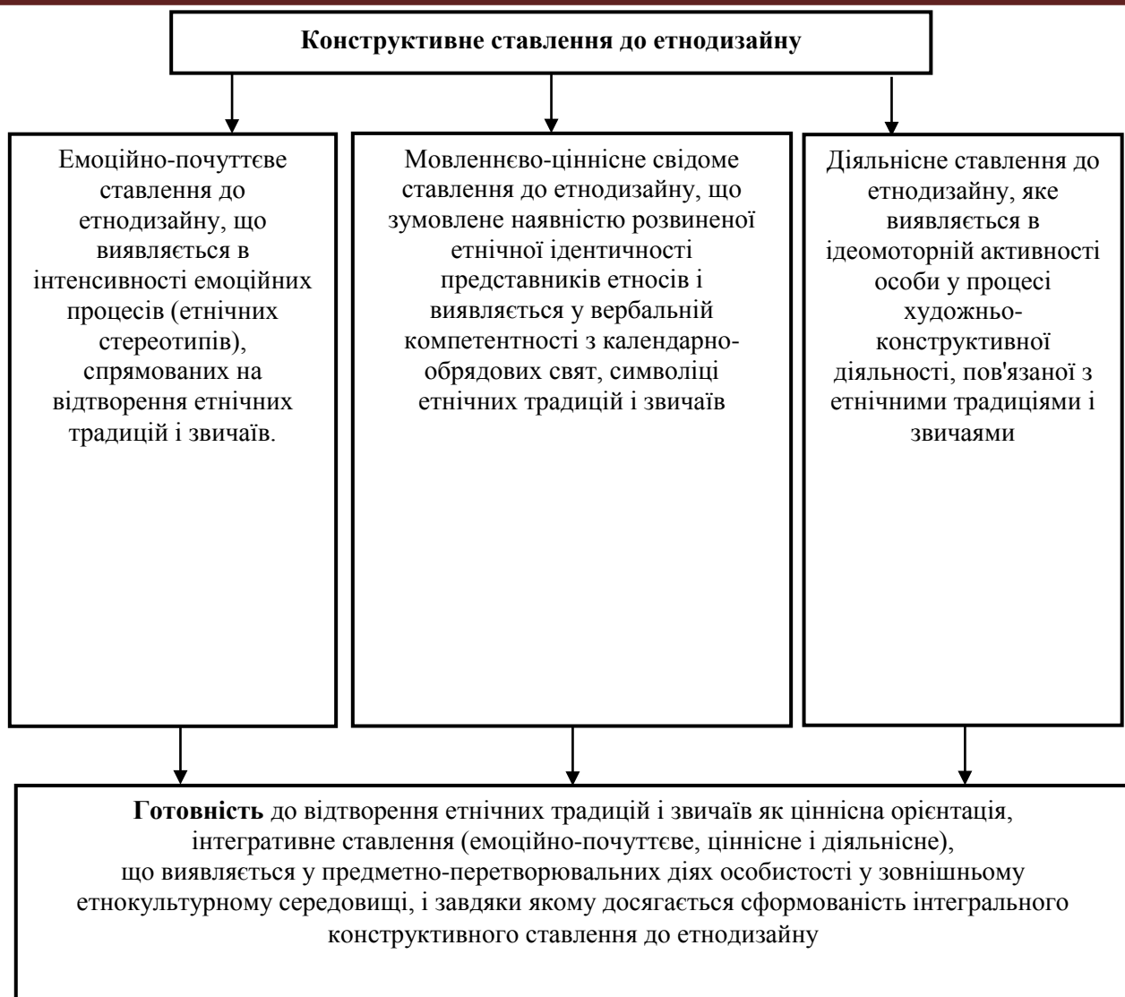
Рис. 2. Конструктивне ставлення особистості до етнодизайну 11

Здібності учнівської молоді зумовлюються і розвиваються завдяки взаємодії із середовищем свого історико-етнографічного регіону. Освіта, позбавлена підґрунтя етнічної культури, є «освітньою системою невігластва». Вона зосереджена на зовнішніх характеристиках навчальних досягнень і заперечує духовні етнічні знання і це призводить етнічну свідомість «до матеріальної засліпленості» [3].