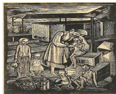
Рис. 3. С. Налепинська-Бойчук. «Голод»