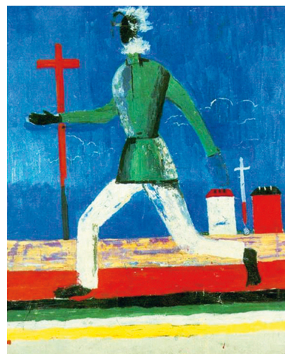
Рис. 7. К. Малевич. «Людина, що біжить»

постаті, які у формі авангардної абстракції звинувачують владу у винищенні селянства. На малюнку олівцем «Де серп і молот, там смерть і голод» (рис. 6) (цитата з популярної у 1920–1930-ті рр. народної пісні) зображені три фігури, риси обличчя в яких замінені на серп і молот, хрест і труну. Селянин, що біжить між хрестом і мечем, — це образ Голодомору 1932–1933 рр. (рис. 7).