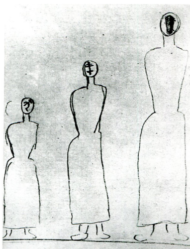
Рис. 6. К. Малевич. «Де серп і молот, там смерть та голод»