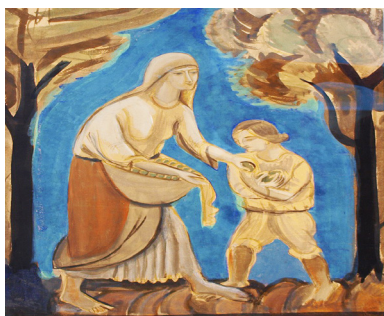
Рис. 1. М. Бойчук. «Урожай»

Страждання українського народу під час Голодомору не могло пройти повз увагу, серце і розум К. Малевича, митця, який народився і виріс в Україні, про якого французький історик мистецтва Жан-Клод Маркаде написав в одній із своїх монографій: «Малевич був єдиним художником, що показав трагічне становище