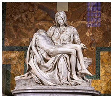
Рис. 2. Мікеланджело. «П'єта»