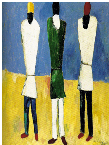
Рис. 5. К. Малевич. «Поневоле на Україна»

Зацікавившись супрематичними композиціями Малевича, один з учнів представив на практичному занятті його картину «Чорний квадрат» (рис. 4) під заголовком «Квадрат = відчуття, біле поле = ніщо поза цим відчуттям». Цей заголовок перетворив знайому для всіх геометричну форму, зображену на картині, на емоційну рефлексію людського страждання, яка була навіки перевтілена художником в абстрактний символ чорного квадрата в білій пустоті. Інші учні також представили декілька «селянських» картин, які містять у собі «завуальовані повідомлення» в символах відсутності обличчя і рук. На картині «Поневоле на Україна» (рис. 5) зображені безрукі і безликі