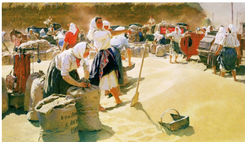
Рис. 9. Т. Яблонська. «Хліб»

Висновок. Практичні заняття з історії України стали чудовою нагодою перетворити урок з «монологу» викладача на демократичну дискусію, в якій педагог і учні «на рівних» пробуджують взаємний інтерес до такої складної теми як Голодомор. Естетичне розуміння того часу очима видатних діячів мистецтва, як-от подружжя Михайла і Софії Бойчуків, Казимир Малевич, Катерина Білокур і Тетяна Яблонська перетворили подану вчителем інформацію про Голодомор на творчу рефлексію і розширили інтелектуальний та креативний простір для реалізації творчих здібностей і учнів, і викладача.