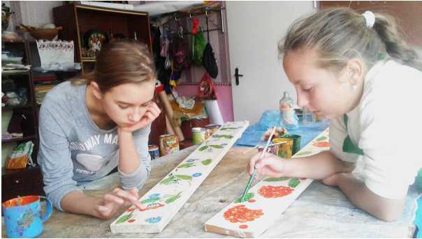
Рис. 4.1. Робота над елементом оздоблення