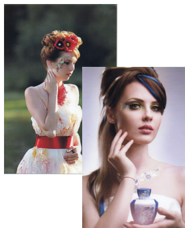
Рис. 1. Роботи випускників гуртка.

Завдяки тому, що в стінах школи № 120 м. Дніпра гурток міської станції юних техніків працює дуже багато років, уже випускники, ставши дорослими, створивши власні сім'ї, приводять своїх діточок до рідної школи. А ми охоче підхоплюємо нове покоління, долучаючи малечу до цікавої справи.