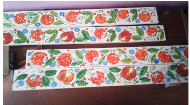
Рис. 4.2. Готовий елемент оздоблення