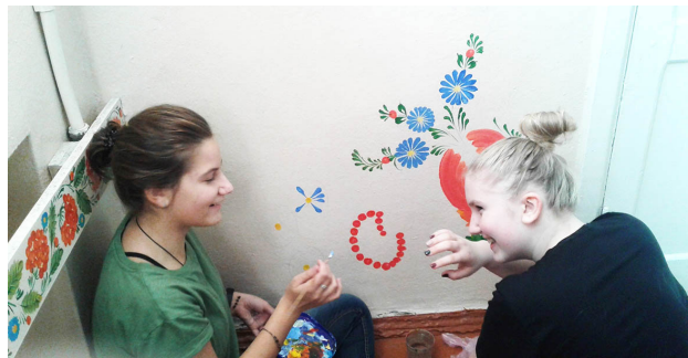
Рис. 4.3. Розташування окремих елементів в інтер'єрі