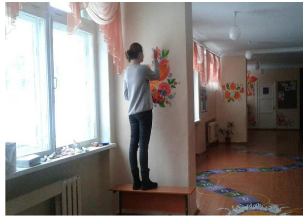
Рис. 3. Обов'язкова умова роботи — природне освітлення інтер'єру

Не уникнули й помилок. Спочатку використовували олійні фарби, однак малювати ними вихованцям було не зовсім зручно. Фарба дуже довго висихає і не дуже гарно покриває поверхню.