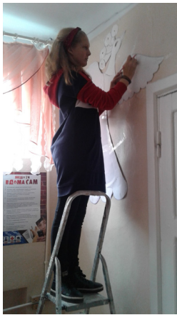
Рис. 2. Підготовка малюнка птаха