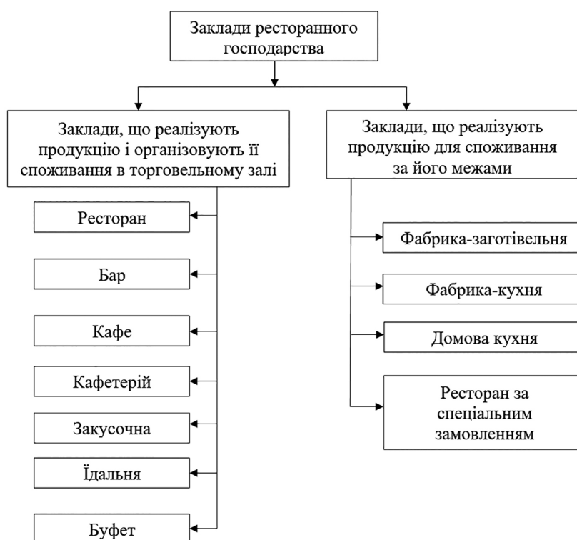
Рис. 1. Загальна класифікація закладів ресторанного господарства

туризму, відіграє важливу роль в економіці області. Туризм, ставши глибоким соціальним і політичним явищем, робить значний внесок як в економічний розвиток країни, так і в підвищення якості життя людей у регіоні. Створення сучасної індустрії туризму не є можливим без підприємств ресторанного бізнесу, які посідають важливе місце в цій сфері діяльності [8].