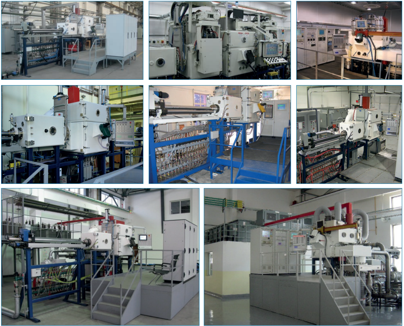
Електронно-променеві установки, розроблені та виготовлені в МЦ ЕПТ, працюють в КНР, США, Канаді та Індії

Beijing Aeronautical Manufacturing Technology Research Institute, Beijing Institute of Aeronautical Materials), так і на промислових підприємствах в містах Сіань, Гуїчжоу, Шеньян, Харбін, Ченгду.