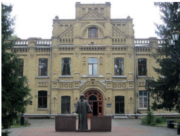
Головний корпус КНУ (роки навчання 1937–1941)

початковано багато напрямів соціогуманітарних досліджень (і засновано відповідні структурні підрозділи або навіть цілі наукові установи), які за радянських часів перебували в немилості, але були вкрай важливими для становлення молодого Української держави.