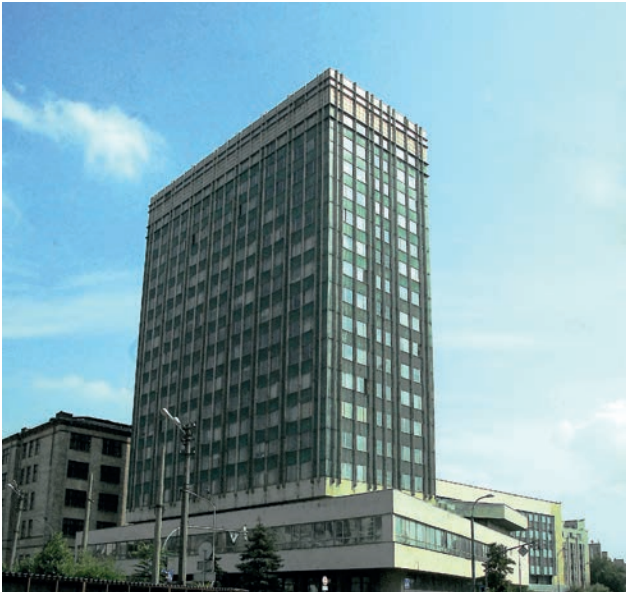
Новий корпус ІЕЗ (роки роботи 1975–2020)

повсякденності, побутовості, це розсування горизонтів вусібіч. В одній з праць французького астронома Каміля Фламмаріона вперше з'явилася знаменита нині гравюра невідомого автора, яка, по-моєму, геніально передає суть науки: на ній зображено людину, яка зазирає за межі небесної сфери — у відкритий космос. Вона не отримує від цього миттєвої практичної користі, крім хіба суто професійного задоволення, але не може інакше.