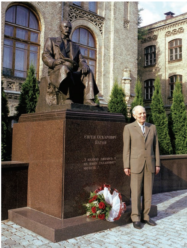
Батько та син (у дворі НТУУ «КПІ»)

До речі, він науковий представник України в CERN, що само по собі дорогого коштує.