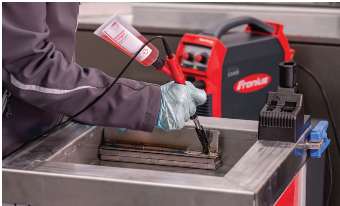
MagicCleaner 150 — легка підготовка до роботи та простота використання

регулювати споживання електроліту. Це сприяє економії ресурсів і дає змогу досягти екологічності виробництва. За допомогою MagicCleaner розчин електроліту доставляється саме туди, куди потрібно. Фетр для очистки та полірування, щітки, що входять у комплект, проникають у кути та щілини, забезпечуючи оптимальне очищення з мінімальним використанням матеріалів. Електрохімічне очищення значно економніше, ніж звичайне травлення в хімічних ваннах, і не руйнує матеріал, як піскоструменева обробка. Розробники подбали, аби користувачі могли легко та швидко ввести обладнання в експлуатацію, й реалізували інтуїтивно зрозумілу концепцію керування. Завдяки цьому усі важливі параметри (режим роботи, характеристики очищення та показники споживання електроліту) можна переглянути та налаштувати на передній панелі пристрою. Пристрої вирізняються легкістю й енергоефективністю, оскільки втілили в собі новітню інверторну технологію. Ця технологія забезпечує вихідну потужність на рівні пристроїв попереднього покоління за меншого споживання електроенергії.