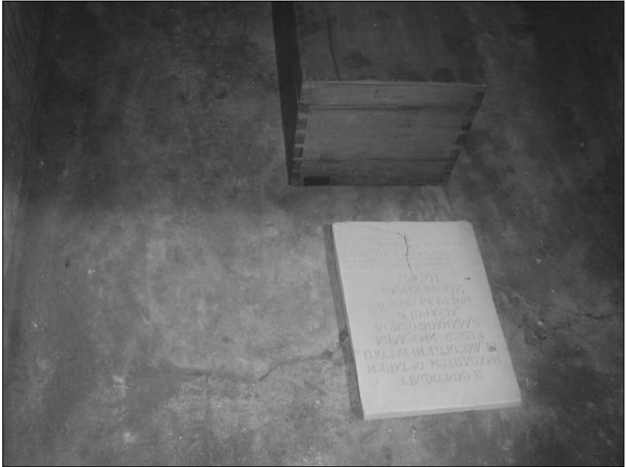
Мал. 1. Скринька та керамічна плита в саркофазі

Як впливає з акта, місце стику, а також щербини ще в давнину були замазані вапном. Закриваючи саркофаг після досліджень, наші попередники замазали місце стику цементно-вапняним розчином. Саме цей розчин і відпав, коли ми відкривали саркофаг 10 вересня. Тож пам'ятці не було завдано жодних пошкоджень.