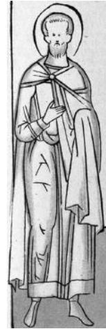
Мал. 3. Св. Іоанн Воїн. Кінець XVII ст.

Обабіч св. Іоанна Хрестителя знаходяться двоє святих, яких можемо звести до другого рангу покровителів гетьмана. Праворуч зображено св. Іоана Богослова з відкритою книгою, на сторінках якої читаємо слова з написаного святим Євангелія: “Бл(а)г(ода)ть и истина Іу(су)с(омъ) Хр(ис)томъ бысть” (Ін. 1:17). Вочевидь, вибір цієї перикопи зі Святого Письма є не випадковим. Тема благодаті, активно обігрується у текстах гравюри. “Визначений посланець першої серед церков Софії, я закликаю благодать на гетьмана Іоанна. Не тільки та [благодать], що просто перебуває на плечах благословенного хрестоносського дому, а й воздвигнута на висотах велич і слава Господня, твоя благодать, нехай буде оспівана”. Про те, що на гетьмані уже перебуває Божественна благодать свідчить перевернутий напис за спиною постатей святих: “Бл(а)г(ода)тію Б(о)жією есмь, еже есмь. И бл(а)г(ода)ть его яже во мнѣ не тїцае(т)” (1 Кор. 15: 10).