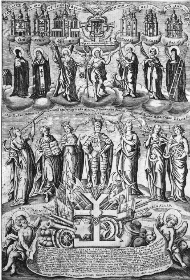
Мал. 1. Гравюра Івана Мигури на честь гетьмана Івана Мазепи. 1705 р.

церква Всіх святих, Переяславський собор 4 . Натомість, О. Крайня відмітила, що, виходячи з символіки і текстів гравюри, на ній могли бути зображені тільки київські храми і атрибутувала один із них як Вознесенську церкву Києво-Печерського жіночого монастиря 5 . Ми не можемо не погодитися з цією гіпотезою, адже Мигура у тексті згадував саме київські церкви, донатором яких був гетьман: “Заходиши до слави церков, славетний патроне, і бачиши ще один врожай промовистої перемоги”.