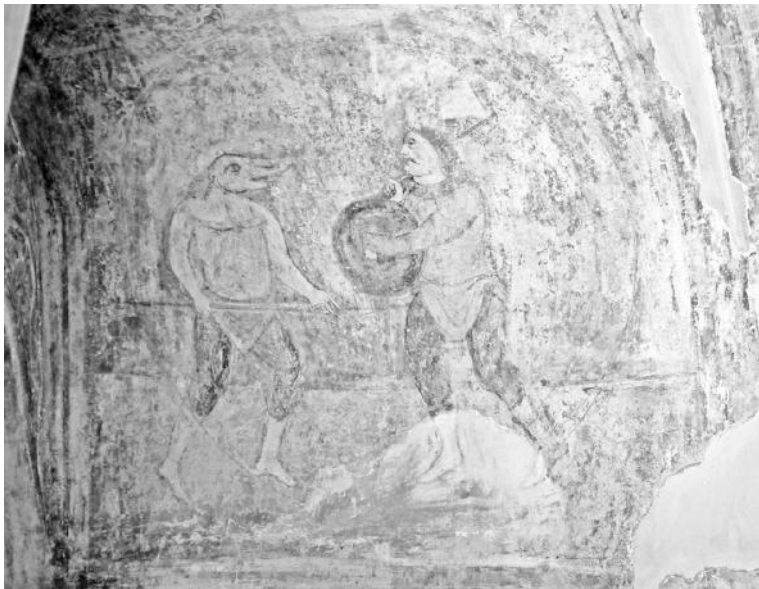
Рис. 8. Готские игры. Фреска северной башни

Фрески северной башни свидетельствуют, что 1 января 988 г. состоялась и коронация принцессы Анны как невесты киевского князя Владимира 44 . Здесь, на стене верхней лестничной площадки, изображена большая церемониальная сцена коронационного выхода византийской царицы. Действие разворачивается на открытой террасе, примыкающей к комплексу смежных дворцовых сооружений, из которых ведет выход на террасу. Здесь изображен Трибунал ареи, где перед народом происходит коронационный выход молодой царицы в сопровождении зосты (опоясанной патрикианки) и в присутствии восседающего на троне василевса с двумя телохранителями. Расположенная на высоте дворцовых залов терраса служила трибуной для церемониальных актов, а внизу, на площади, происходили парады гвардейцев и представителей народа. Причем фреска зафиксировала наиболее торжественный момент – провозглашение ромеями вновь коронованной царицы, о чем свидетельствуют церемониальные жесты ее свиты, сопровождающей такие