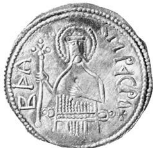
Рис. 11. Изображение Владимира на монете (конец X в.)

М. Грушевский, а вслед за ним – М. Левченко, считают правдоподобным, что Владимир вместе с рукой порфирородной царевны получил корону кесаря, о чем свидетельствуют его монеты, на которых он фигурирует в соответствующем убранстве (рис. 11) 49 . Титул кесаря был вторым после василевса в придворной властной иерархии; его получал сын либо зять императора, причем у зятя в венце было не четыре, как у сына василевса, а лишь одна арочка (киотец) спереди 50 . Именно такой венец у Владимира на его монетах. Недаром кесарские геральдические знаки – грифоны изображены на сводах башен, а царский геральдический орел фигурирует на шиферной плите парапета хор как раз над княжеским портретом (рис. 12).