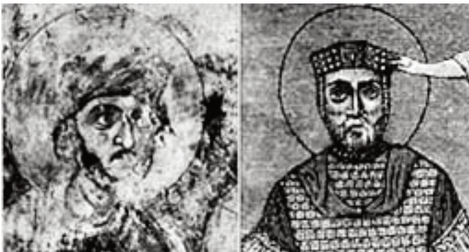
Рис. 4. Василий II на фреске и миниатюре