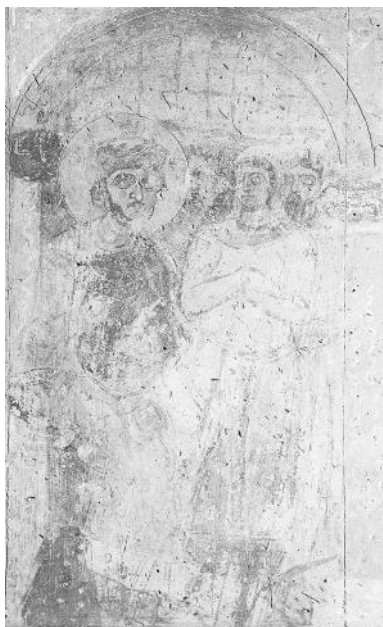
Рис. 2. Императорская ложа. Фреска южной башни “Ипподром”, деталь

главную, завершающую сцену – финиш колесницы возле дворца ипподрома (Кафисмы). Именно эта, кульминационная сцена, сохранившаяся лучше других фресок, наиболее интересна в историческом смысле.