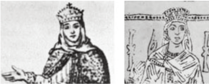
Рис. 10. Анна на княжеском портрете и на фреске башни