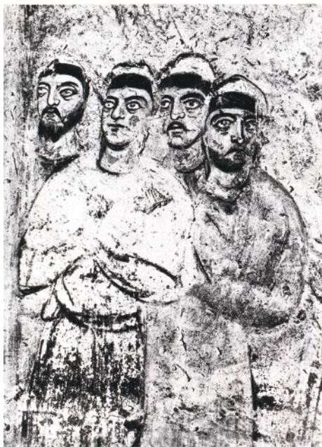
Рис. 5. Посольская ложа. Фреска южной башни "Ипподром", деталь