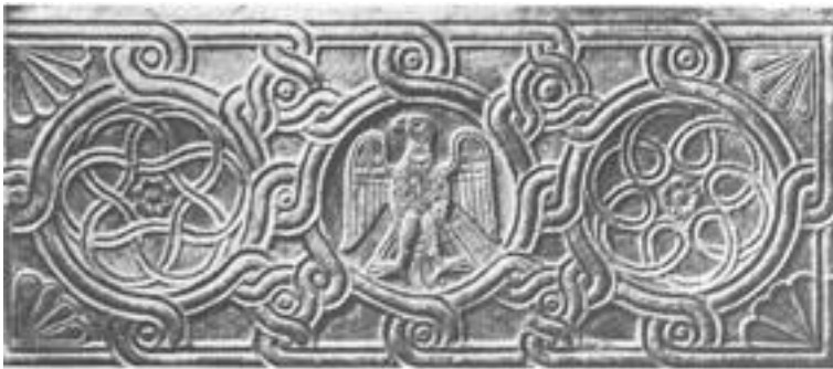
Рис. 12. Геральдический орел на шиферной плите парапета хор

русского посольства, который изображен в императорской ложе ипподрома рядом с Василием II. Как было принято у византийцев, князь, видимо, получил царские регалии во время пребывания византийской миссии в Киеве.