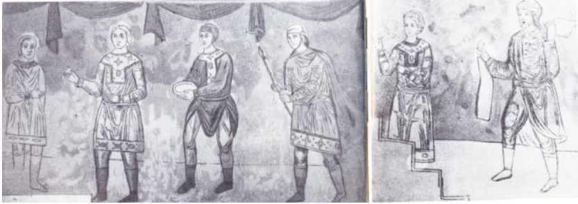
Рис. 6. Коляды. Фреска южной башни в зарисовке Ф.Г. Солнцева (сер. XIX в.)

проходило по зимнему (местонахождению)” может относиться и к декабрю 987 – началу января 988 гг. 37 Это подтверждается фресками, свидетельствующими, что сваты Владимира прибыли в Константинополь в канун Рождества 987/8 гг.