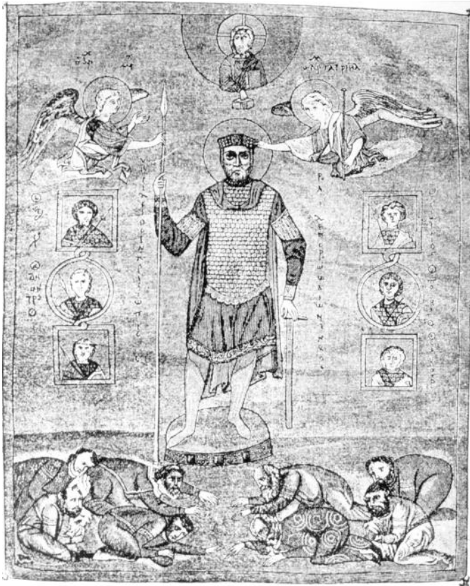
Рис. 3. Василий II – победитель болгар. Византийская миниатюра 1019 г.