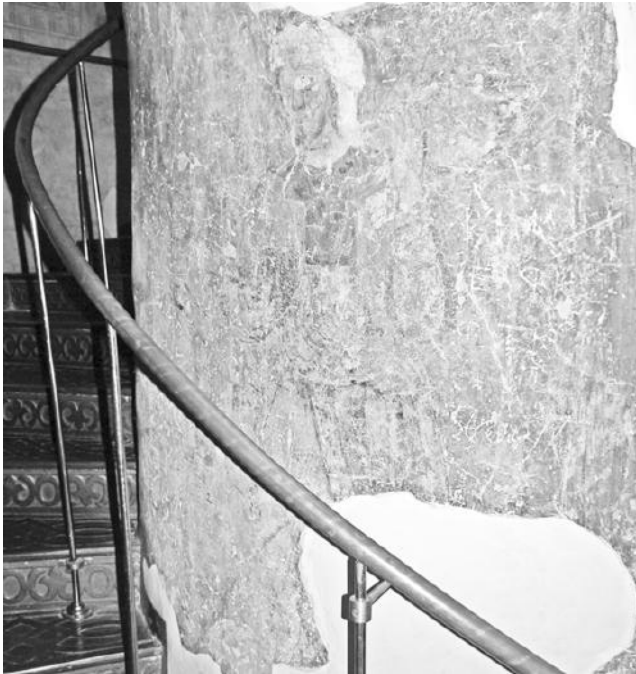
Рис. 7. Колядник. Фреска южной башни, деталь