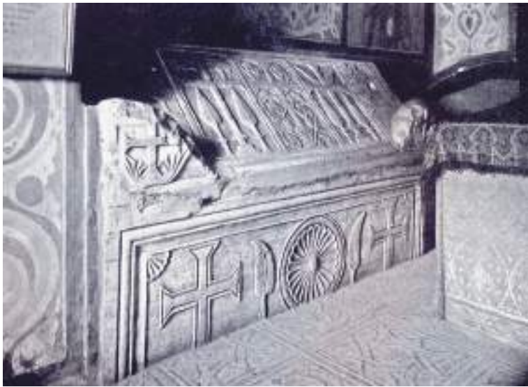
Мал. 7. Гробниця Ярослава до початку досліджень. Світлина початку 1930-х рр.

в останню путь. Таким чином, усипальня була місцем сакрального єднання князя з підданими, які молили за нього Бога, а померлий князь виступав заступником за свій люд перед Ним.