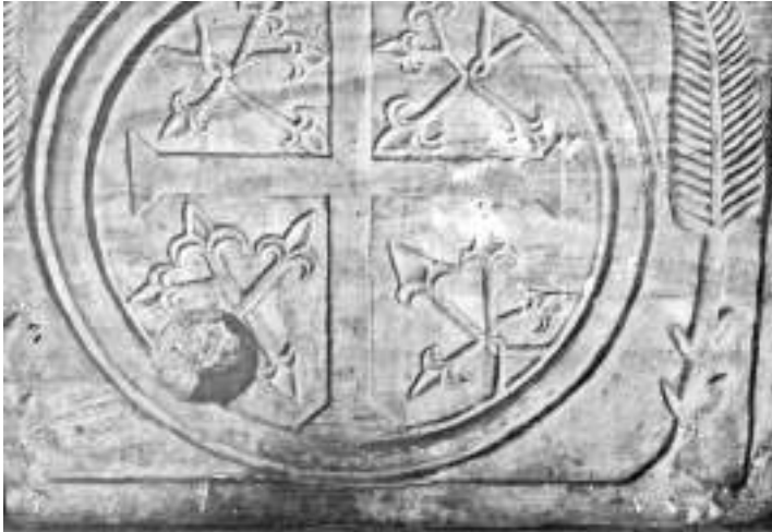
Мал. 4. Гробниця Ярослава. Дослідження 1930-х рр. Закритий вапном отвір на східній стороні саркофага.

У нижній частині східного торця 16 гробниці наявний наскрізний круглий отвір, нині заліплений вапняним розчином. Його зовнішній діаметр – 14 см, внутрішній – 1,5–3 см; у середині саркофага центр отвору знаходиться на висоті приблизно 7 см від рівня дна 17 . Оскільки він порушує різьблений декор стінки (мал. 4), то, безперечно, виконаний пізніше.