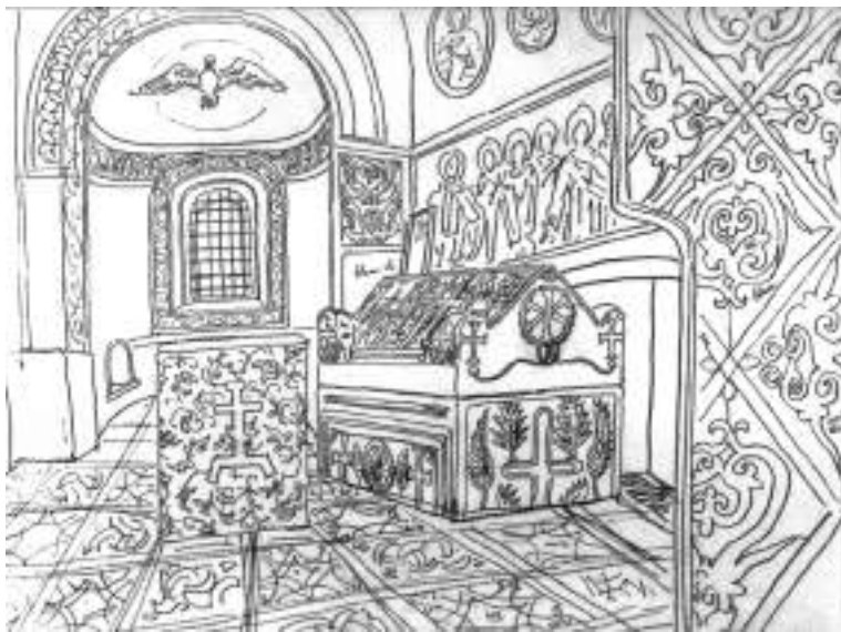
Мал. 6. Гробниця Ярослава у Володимирському вівтарі. Мал. К. Мазера. 1851 р.

дослідженнями, усипальня Ярослава в давнину – це не лише загісне вівтарне приміщення з його саркофагом, як її до сьогодні сприймають згадані дослідники. Насправді вона була розкішним великокняжим ритуально-поховальним комплексом, що складався з кількох приміщень. Усипальня завершувала собою зі сходу внутрішню і зовнішню північні галереї. До речі, поховальні галереї з архітектурно виділеними в їхніх східних торцях приділами-каплицями добре відомі в архітектурі княжих усипальниць Давньої Русі 58 . Саркофаг Ярослава стояв у невеликій каплиці внутрішньої галереї (там, де, власне, й зараз), а поруч, у поєднаному з нею дверима суміжному приміщенні зовнішньої галереї, влаштували простору каплицю для заупокійних відправ (паракліс). У східній частині параклісу відспівували померлих князів, а західна являла собою велике приміщення зального типу, в якому збиралася знать для проводів небіжчика