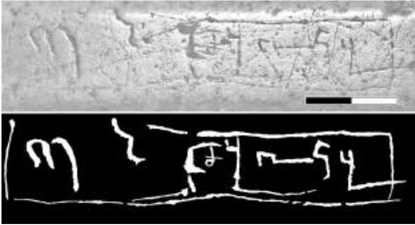
Мал. 13. Фотографія та прорисовка пам'ятного вірменомовного напису 1607 р.

літочислення складатиме 1607 р. Таке датування, як показують сучасні дослідження, не суперечить хронології вірменських написів Софії Київської, вписуючись у ті часові рамки, коли в східній частині південної внутрішньої галереї храму функціонувала вірменська каплиця 82 .