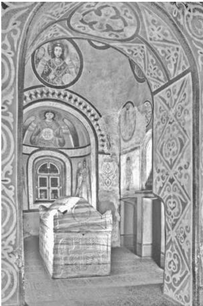
Мал. 1. Усипальня князя Ярослава Мудрого у Софії Київській. Сучасний вигляд.