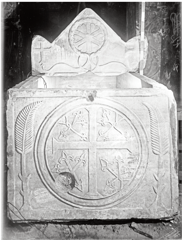
Мал. 9. Дослідження гробниці у 1936 р. Вигляд зі сходу

десятиріччям XI ст. 62 Цим словам повністю вторить П. Толочко, який, посилаючись на Є. Архіпову, зазначає, що так само вчинив і Святослав Ярославич, який “будучи великим київським князем . . . заповідав поховати його в Чернігові, в соборі св. Спаса. Із цього, як слушно вважає Є. Архіпова, випливає, що свою усипальню він приготував ще тоді, коли був чернігівським князем” 63 . Однак варто зауважити, що наведений нами приклад поховання київського князя Святослава у Чернігові вирвано Є. Архіповою з контексту наших міркувань щодо феномену влаштування в Софії тільки двох княжих усипалень – Ярослава та Всеволодовичів.