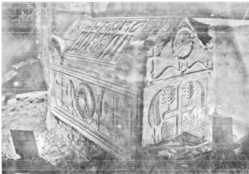
Мал. 8. Дослідження гробниці у 1935 р. Розкрита з північного боку база з цегли XVIII ст. Фото І. Самойловського

особливий патріарший дозвіл, адже таке нововведення суперечило прийнятому тоді на Русі церковному Уставу патріарха Олексія Студита 60 .