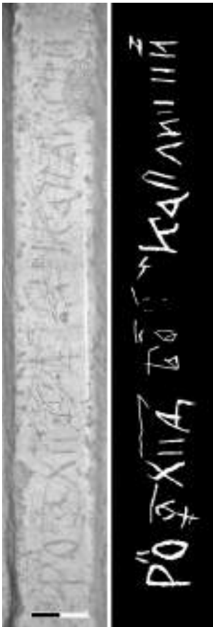
Мал. 11. Фотографія та прорисовка пам'ятного напису Каплицького 1624 р.

Втім, повні формули пам'ятних написів доволі рідкісні, зазвичай автори вказували своє ім'я та рік відвідання храму. Так, у верхній частині північного схилу віка саркофагу на лінії розмежування видряпані два написи, причому один виконаний поверх другого.