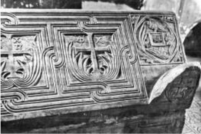
Мал. 3. Гробниця Ярослава. Деталь віка. Фото 1950 р.

на акротеріях встановлювали або зображали апотропеї-маски, тут такими апотропеями є хрести 12 . Довжина гробниці – 2,33 м, ширина – 1,17 м, висота – 1,63 м, товщина стінок – 0,13 см 13 , вага – 6 т. Вона складається з чотирьохтонного прямокутного ящика і двосхилого віка вагою 2 т, виготовлених з цільних брил мармуру.