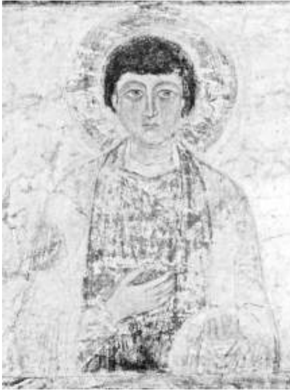
Мал. 10. Св. Пантелеймон. Фреска Володимирського вівтаря. Перша чверть XI ст.

відомо. Про це писав М. Петров, який пов'язував появу написів із занедбанням собору 75 . Однак дослідження епіграфічних пам'яток не було проведене, хоча дослідники зазначали його важливість 76 . На цьому заклик вивчення графіті на саркофазі на певний час і завмерло.