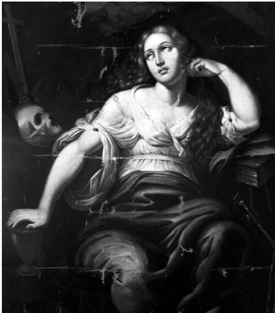
Мал. 5. Марія Магдалина. Невідомий художник другої половини XVIII ст. Полотно, олія. Деталь. Стан картини на завершальному етапі реставрації. Художник-реставратор першої категорії Світлана Дікуть. Реставраційні майстерні НХМ РБ

духів (Лк. 8:2) 4 . У різний час до цього образу звертались численні майстри, накладаючи на нього відбиток свого часу. У цьому контексті найвірогідніше