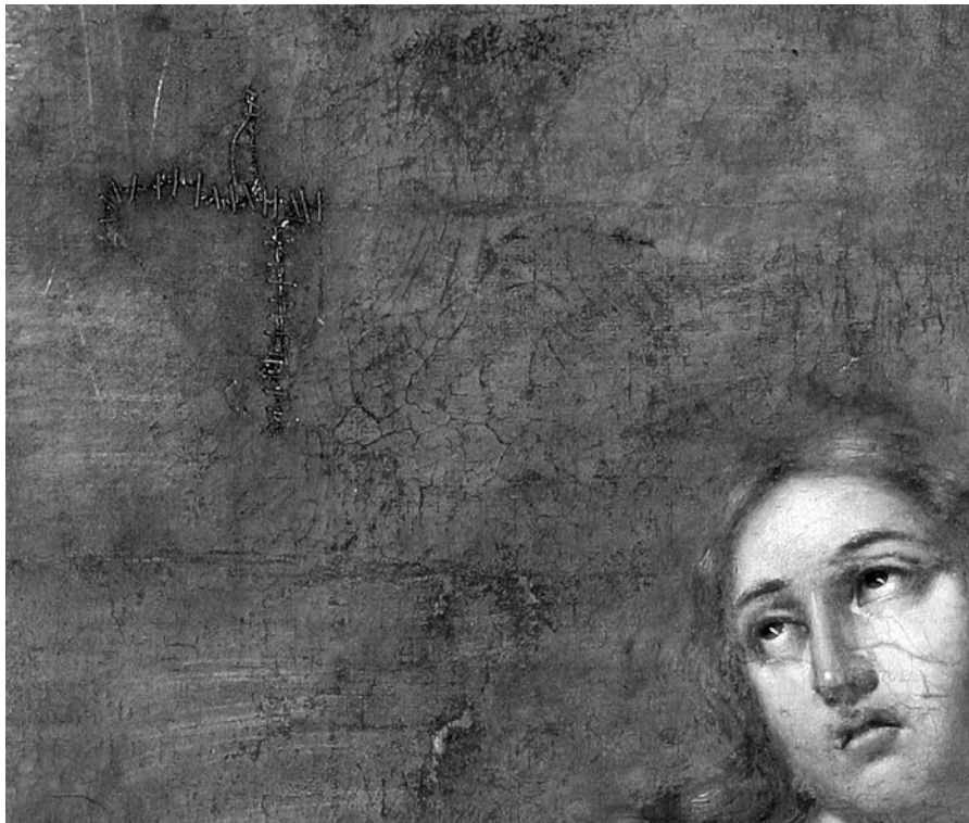
Мал. 2. Марія Магдалина. Невідомий художник другої половини XVIII ст. Полотно, олія. Деталь. Стан до реставрації. Доволі чітко простежується штопання полотна

виявила справжній талант та високу майстерність, завдяки яким ми маємо можливість дослідити надзвичайно цікавий мистецький твір 3 .