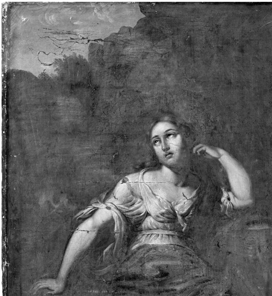
Мал. 1. Марія Магдалина. Невідомий художник другої половини XVIII ст. Полотно, олія. Деталь. Стан до реставрації