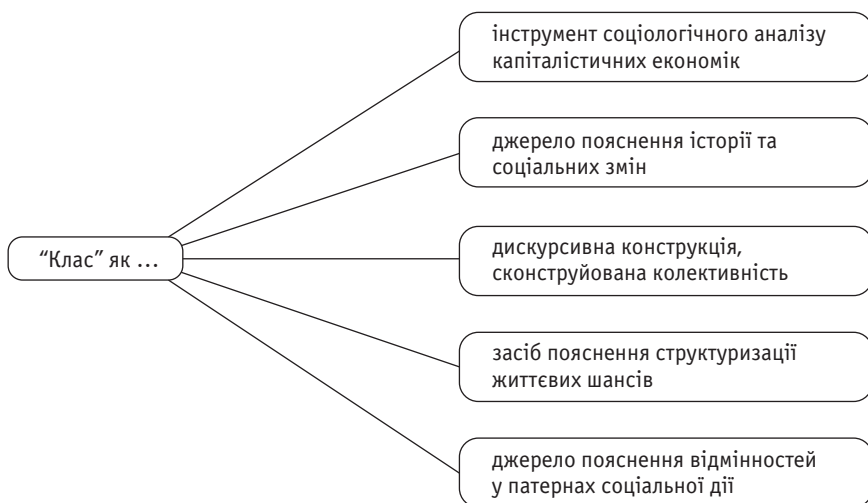
Рис. 2. Тематичні кластери класового аналізу (Горан Терборн)

За Терборном, ці п'ять тематичних кластерів, що в різний час мали найбільше значення для класових аналітиків, актуальні й для сучасного класового аналізу. Він вважає, що вельми корисною дослідницькою програмою для вчених, які цікавляться класом, буде просування в напрямку, протилежному локальному звуженню до масштабу занять (як у концепції Граскі та Віден), — у напрямку порівняльних досліджень класових культурних сприйняття, дискурсивних і політичних стратегій у різні періоди й на різних континентах, а також вивчення, з одного боку, інтерфейсів національних соціально-економічних розшарувань, інститутів і розподільних процесів, а з іншого — глобальних чи транснаціональних потоків та історичних умов.