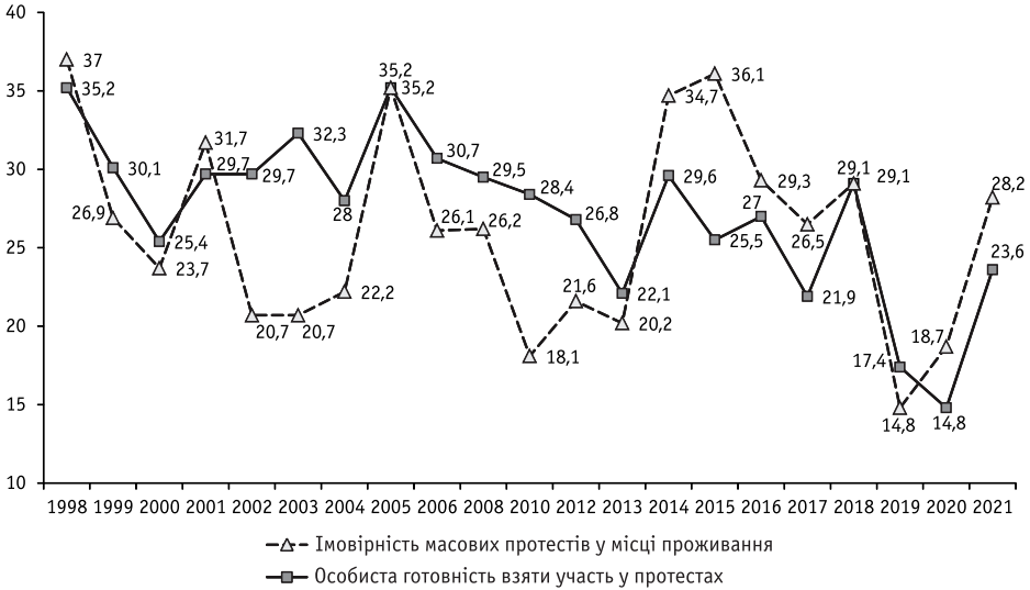
Рис. 3. Динаміка оцінок імовірності масових протестів та особистої готовності взяти в них участь (% тих, хто дав ствердні відповіді)