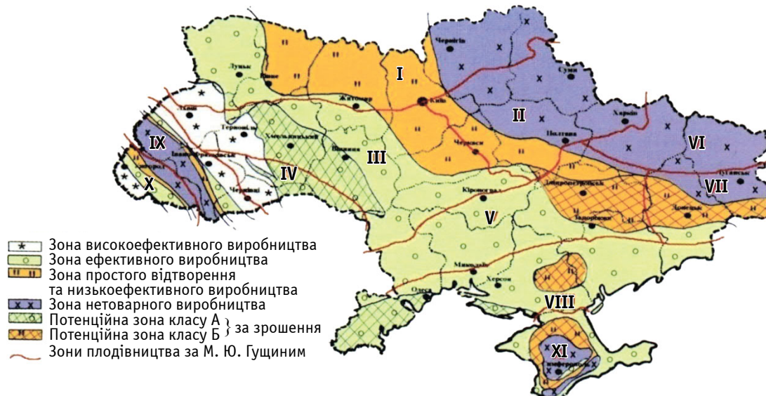
Рис. 1. Агроекологічне районування України за рівнями потенційної економічної ефективності товарних насаджень волоського горіха [8]

Для зони ефективного виробництва волоського горіха в зоні Степу рекомендовано сорти селекції Українського НДІ лісового господарства та агролісомеліорації ім. Г. М. Висоцького 'Колгоспний', 'Красавець', 'Курзім' і 'Щепотьєвський'.