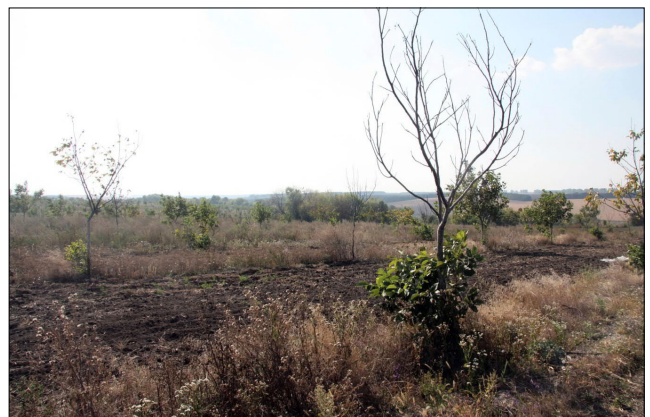
Рис. 4. Сортний горіховий сад пошкоджений морозами (Черкащина, серпень 2016 р.)