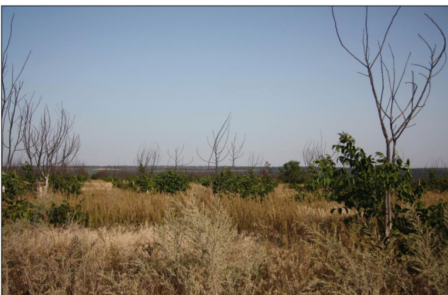
Рис. 3. Сортний горіховий сад пошкоджений морозами (Молдова, вересень 2015 р.)

У Державному реєстрі сортів рослин України на 2018 р. відсутні сорти народної селекції 'Бомба', 'Гроновий', 'Паперовий', а також селекції Українського НДІ лісового господарства та агролісомеліорації ім. Г. М. Висоцького 'Колгоспний', 'Красавець', 'Курзім', 'Щепотьєвський', селекції Придністровської дослідної станції садівництва 'Придністровський', селекції Нікітського ботанічного саду 'Альмінський', 'Аркад', 'Боспор', 'Бурлюк', 'Карлик 3', 'Карлик 5', 'Конкурсний', 'Пам'яті Пасенкова', 'Подарунок Валентини', 'Пурпуровий', молдовський 'Calarașchi', зареєстрований ТОВ