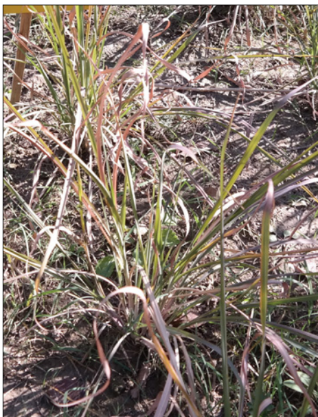
Рис. 3. Рослини M. sacchariflorus (2n) першого року вегетації, отримані в умовах in vitro (фаза кущіння)