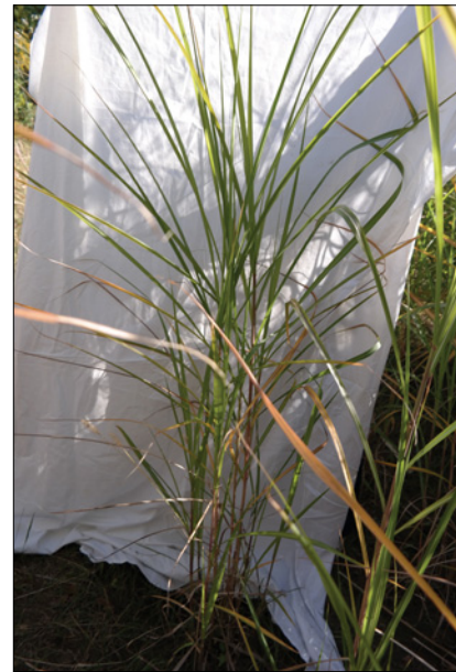
Рис. 1. Рослини M. giganteus першого року вегетації, отримані в умовах in vitro (фаза куцїння)

Спостереження за ростом і розвитком рослини M. sinensis , M. sacchariflorus (4n) та M. sacchariflorus (2n), а також рослини