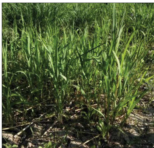
Рис. 4. Рослини M. sacchariflorus (4n) першого року вегетації, отримані в умовах in vitro (фаза кущіння)

відростають у середньому на 7 діб швидше). Фаза кущіння в контрольних зразків настає через 50–55 діб після відростання. Такими ж темпами кущіння характеризуються рослини M. giganteus , отримані в культурі in vitro . А от рослини M. sacchariflorus (2n) та M. sacchari-