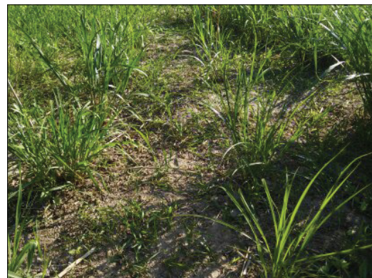
Рис. 2. Рослин M. sinensis першого року вегетації, отримані в умовах in vitro (фаза куцїння)

M. giganteus першого року вегетації, які були висаджені з колб безпосередньо в ґрунт наприкінці травня – початку червня 2014 р., засвідчили, що всі види успішно перезимували і витримали морози до -20 °С.