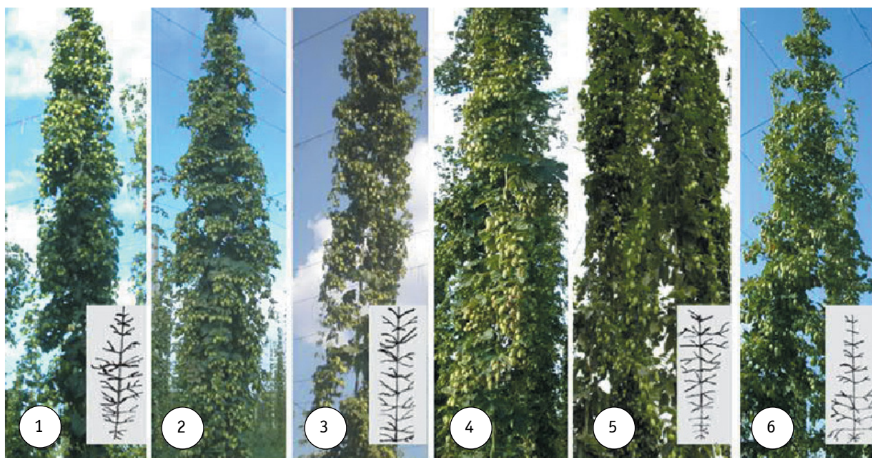
Рис. 2. Виявлення ознаки «габітус куща» у вітчизняних сортів (1 – ‘Зміна’, 2 – ‘Потіївський’, 3 – ‘Слов’янка’, 4 – ‘Заграва’, 5 – ‘Гайдамацький’, 6 – ‘Альта’)

середньостиглої (118–128 днів) та пізньостиглої (130–145 днів) груп (44%), невелика кількість (7%) зразків – ранньостиглих (90–116 днів).