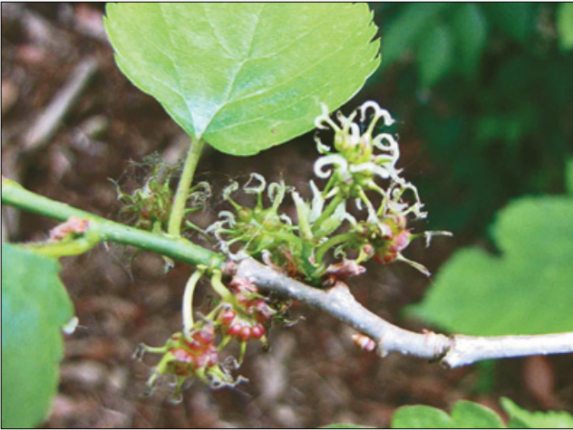
Рис. 3. Аномалії в будові квіток шовковиці білої

фікації сортозразків шовковиці плодової M. alba виділено чотири типи суцвіть. А саме: утворені з жіночих квіток; з чоловічих; із двостатевих; комбіновані (з чоловічих, жіночих і двостатевих квіток у різних кількісних співвідношеннях). Перспективними для майбутніх досліджень є добір та оцінювання селекційних форм з метою створення нових самоплідних сортів шовковиці з фенотиповою стабільністю кількісних господарсько-цінних характеристик, а також подовженим строком плодоношення.