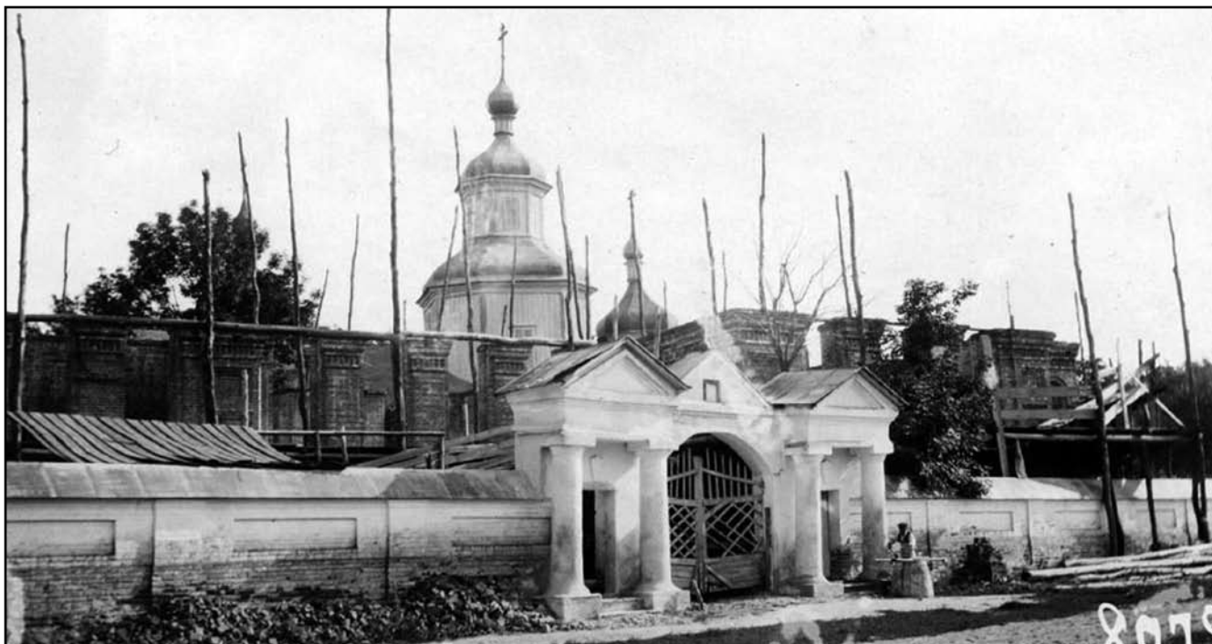
Будівництво нової Вознесенської церкви. Вигляд з південного заходу

нижнеетажної и верхнеетажної церквей» [6, 16].