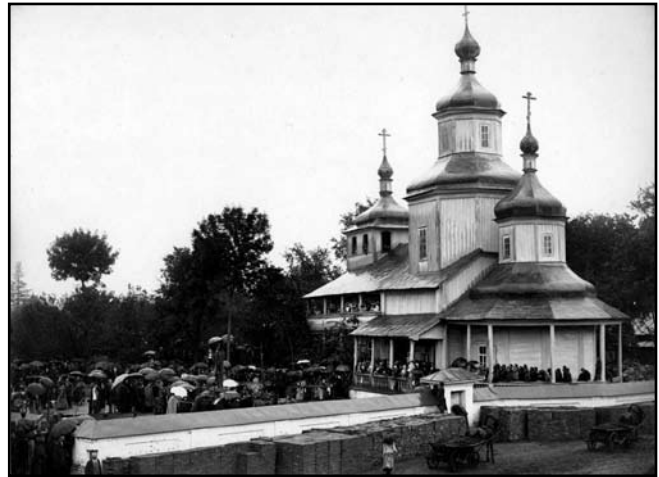
Дерев'яна Вознесенська церква

З приведеного уривка літописного тексту неможливо зрозуміти, якою була ця Вознесенська церква – кам'яною чи дерев'яною. Наступного разу ми зустрічаємо її ім'я в списку храмів Павла Алеппського (1654). Важко сказати, чи мали ці два храми XII і XVII ст. щось спільне, окрім