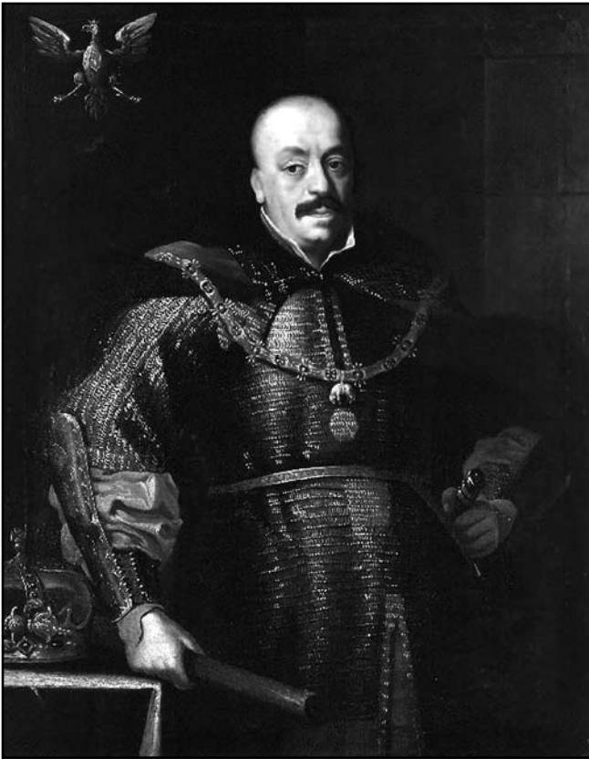
Рис. 1. Польський король Ян II Казимир

на яких було насипано вали та збудовано частокіл. З північного боку підходила природна перепона – заплава невеликої річечки Малотечі. Південна та східна сторони були укріплені викопаним ровом і насипаним валом. Зберігся опис Глухова 1654 р., зроблений під час приведення до присяги глухівських козаків та міщан після Переяславської ради: «...А город Глухов стоит меж речки Усмани на острову. Около посаду, меж речки, землею город. На старосвитцком городище сделана два вала земельных; около тех валов два рва; на том валу надолбы; меж тех валов башен нет. В том землею городе поставлена церковь деревяная во имя архангела Михаила; у тое церкви служащей поп Григорей. Да подле того ж земельного города поставлен был Песочинского пана двор на горе над речкою Усмани; около того двора, с трех сторон осыпь земляная; на осыпи поставлен острог дубовой; межи того острога сделаны ворота проезжие, на воротех и глухих наугольных башен меж того острога нет. Около того острога сделан ров, а ров к острогу огорожен бревнами с одной стороны, и подле того острога у земли сделан честик, колье дубовые, да около слобод того города Глухова на всполье сделал ров для приходу воинских людей. Да к тому ж городу Глухову уездные села...» [8]. З цього опису можна зробити висновок, що Глухів мав складну триділну систему укріплень: замок, укріплений двір Пясочинського та слободу, захищену від поля ровом [9, 208]. Незважаючи