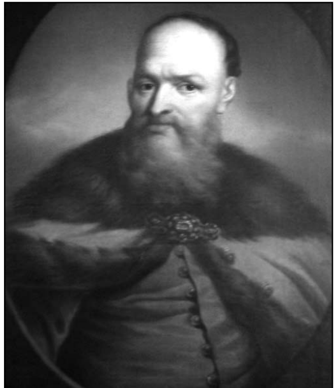
Рис. 4. Польський генерал Стефан Чарнецький

впритул до фортеці, були встановлені дві артилерійські батареї: одна нараховувала дванадцять, друга – шість гармат. Штурм розпочався, як і першого разу, відразу після підриву мін на світанку. О шостій годині ранку піхота при підтримці майже всієї кавалерії кинулась у проломи. Увірвавшись до фортеці, поляки відрубали голови всім захисникам, котрі обороняли місця проломів, і, пробившись до найвищої точки фортеці,