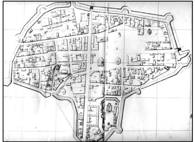
Рис. 6. План Глухівської фортеці 1750 р., укладений квартирмейстером Магнусом фон Рене

Навесні 1711 р. під час своєї подорожі до Києва у Глухові зупинявся датський дипломат Юст Юль. У своєму щоденнику він дав коротку характеристику глухівській фортеці, у якій зазначено, що після