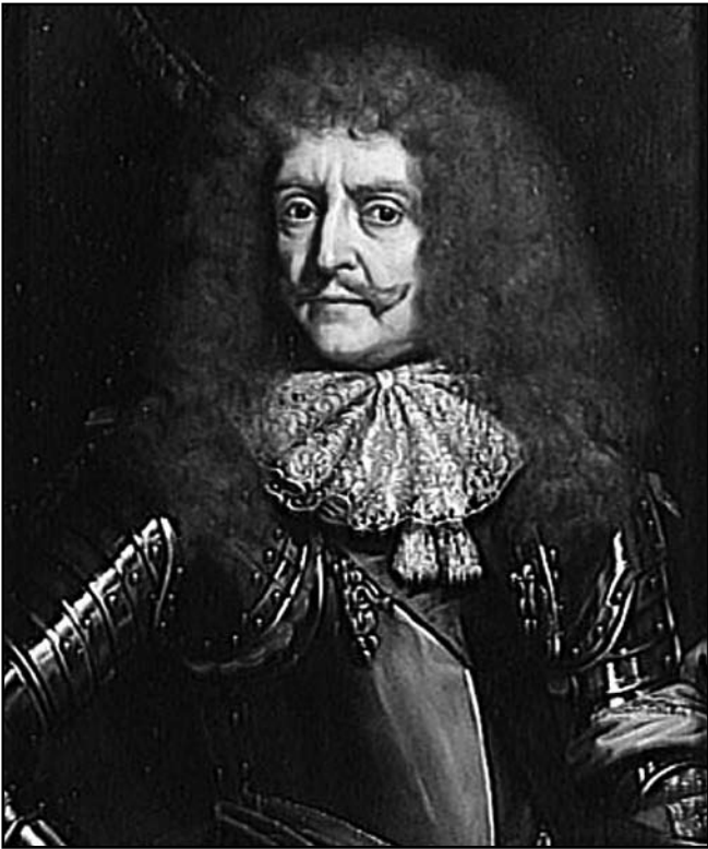
Рис. 2. Французський посланець герцог Антуан де Грамон граф де Гіш