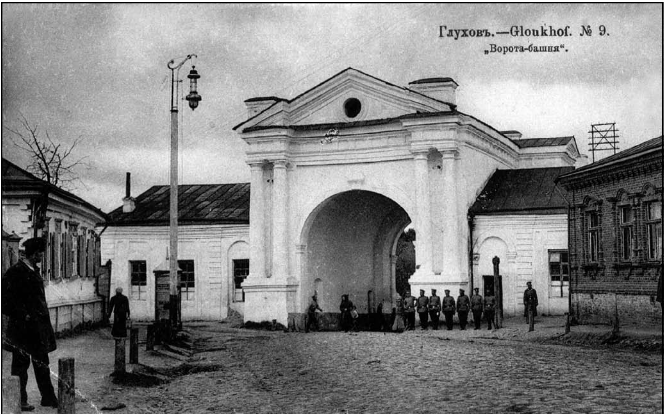
Рис. 8. Київська фортечна брама з кордегардіями

стояли осторонь щільної дерев'яної забудови, вигоріли зсередини. Після цієї пожежі місто втратило свою столичну велич і набуло рис рядового повітового містечка.