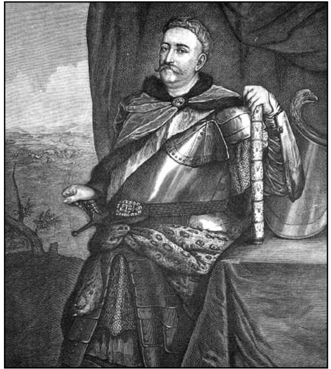
Рис. 3. Коронний великий хорунжий Ян Собеський