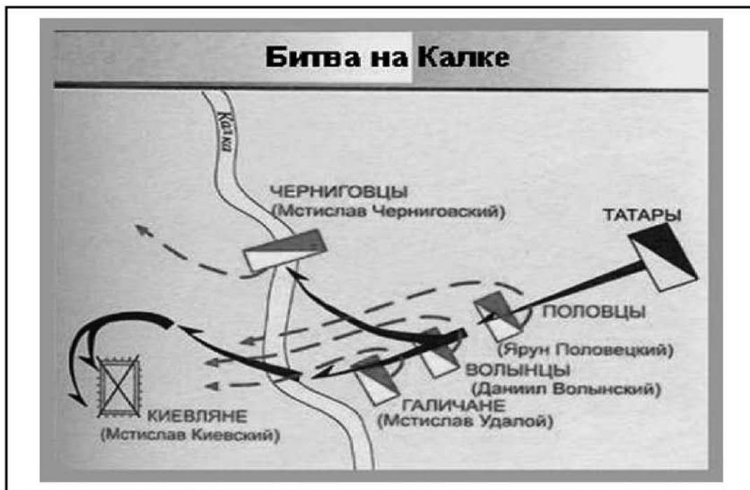
Схема битви на Калці 31 травня 1223 р.

боротьбу з монголами загальноруською справою, а вважаючи, що це проблема самих половців і їх родичів – південноруських князів Київської Русі.