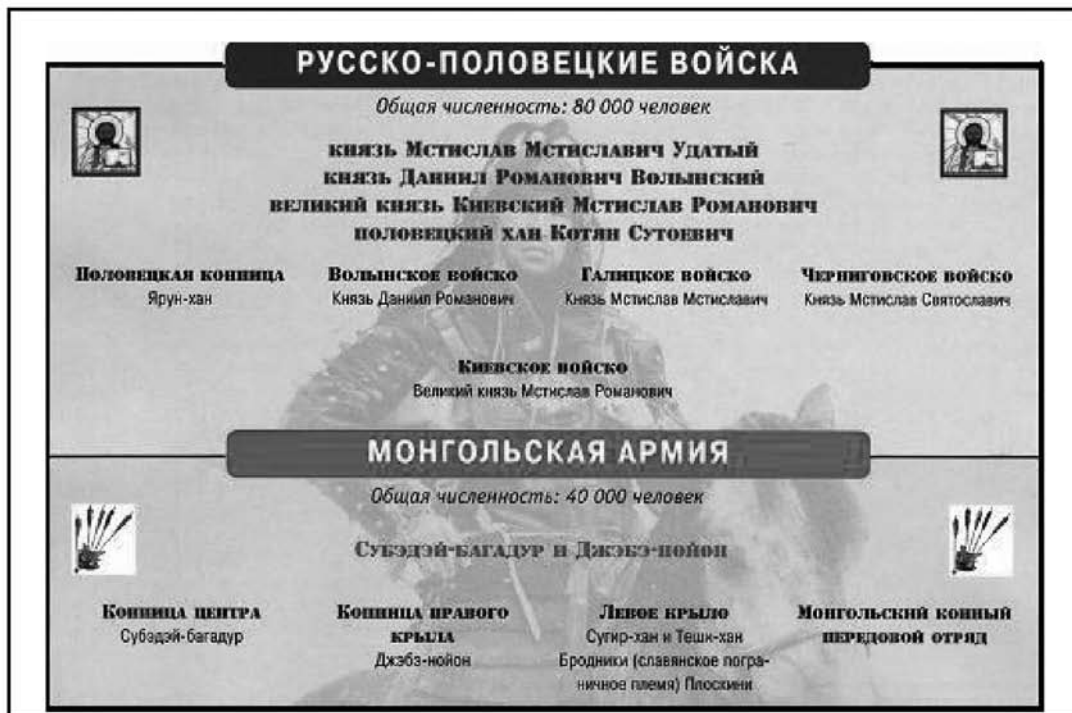
Склад військ у битві на Калці 31 травня 1223 р.