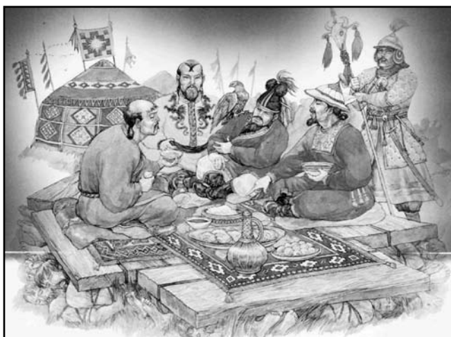
Бенкет монголів на своїх ворогах

переходили річку, а кияни зупинилися на західному боці Калки на деякій відстані від берега в очікуванні.