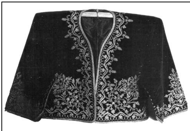
Жіноча кофтина («кирха») з караїмської виставки музею, м. Бахчисарай, 1927–1936 рр. (фотонегатив, КП № 4294/888)

постійно контактували з єдиновірцями з Близького Сходу (зокрема, з караїмськими громадами Дамаску і Багдада), і «часто-густо замовляли там для своїх молитовних домів такі килими» [1, 40]. Ще одним різновидом декоративного шитва було аплікаційне, яке отримало найбільше поширення серед кримських татар-жителів Південного Берега, а також серед караїмів і вірмен Криму. Ця техніка застосовувалася для вироблення килимів, якими покривали стіни кімнат, підлоги в караїмських молитовних будинках «кенасах» [1, 42]. Орнаментальне шитво «пул» (при цій техніці металеві блискітки срібла або золота