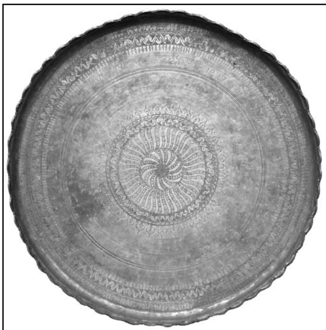
«Сіні», традиційний караїмський піднос (мідь, лудіння, кування, гравіювання; КП № 778/26)

на початку 1927 р. з музейного фонду в основну колекцію поступила партія старовинних килимів без ворсу. Загальною їх особливістю були схематичні рослинні і побутові мотиви, а переважуючою колірною гаммою – інтенсивний темно-синій оксамитовий, жовтий, «рудий» і коричневий