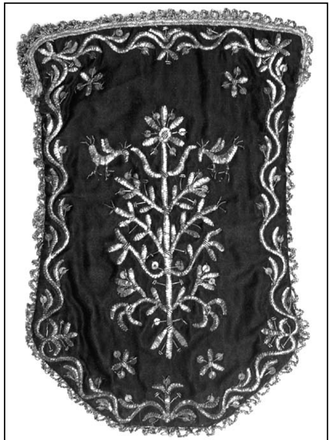
Кусет (КП № 11074/Т1018)

шитва, від форми круглих п'ялец (від «тамбур» – барабан), на яких виконувався цей вид шитва на Близькому Сході до кінця XIX ст. Кримські караїми