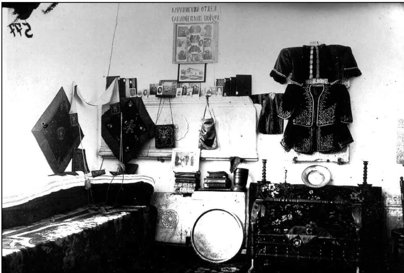
Интер'єр «Караїмської кімнати» музею, м. Бахчисарай, 1927–1936 рр. (фотонегатив, КП № 4293/887)