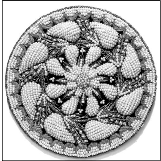
Верхівка караїмської шапочки «фесу» (КП № 1775/577)

Серед мешканців Криму було широко поширеним орнаментне шитво «каснак» – «тамбурна» техніка