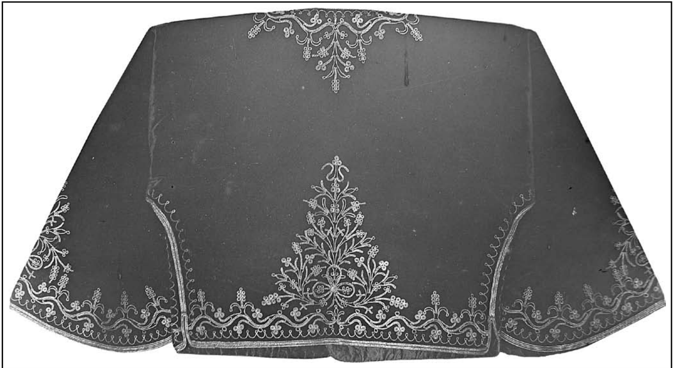
Жіноча кофтина (вигляд ззаду) з караїмської виставки музею, м. Бахчисарай, 1927–1936 рр. (фотонегатив, НВ № 11506)

короткий піджак або куртка з широким рукавом без гудзиків; вироблялися кирхи, зазвичай, з темно-синьої, темно-зеленої, темно-червоної або коричневої тканини, а частіше за все, з той, що мала кавовий колір – і, в основному, з оксамиту – та вишивалася золотими нитками складним рослинним або геометричним візерунком; краї рукавів і комір оторочувалися хутром), дитяча сорочка з косим коміром («кольмек», «кульок») [12, 718; 13, 19; 14, 48-51], молитовний шарф караїмського священнослужителя («чичит»), кисет, дитяча колиска – «бешик» (за караїмськими звичаями, її кріпили тільки дерев'яними цвяхами), три «килими», великий металевий піднос («сіні»), металева миска («тепсі»), пристінні подушки («чатма йастикъ»), покривала на них, декілька «бахча» (відрізів тканини у формі квадрата, що використовували в якості серветки, шалі або вузла, в який завертали одяг, білизну та ін.) [15, 195], а також дерев'яний диван («сет»). Такі сети, зазвичай, мали 2 м в довжину і 1 м завширшки, і стояли на маленьких (8-10 см) ніжках, без спинок. Сети накривали «мандаром» (матрацом, набитим овечою шерстю), а зверху – килимом, уздовж стін обкладали подушками, також набитими овечою шерстю. У ящики сетів вдень прибирали постільне приладдя. Відзначимо також, що жителі Бахчисарая сетом називали глиняне підвищення, що тягнулося на висоті 18 см уздовж внутрішньої частини стін будинку [16, 10].