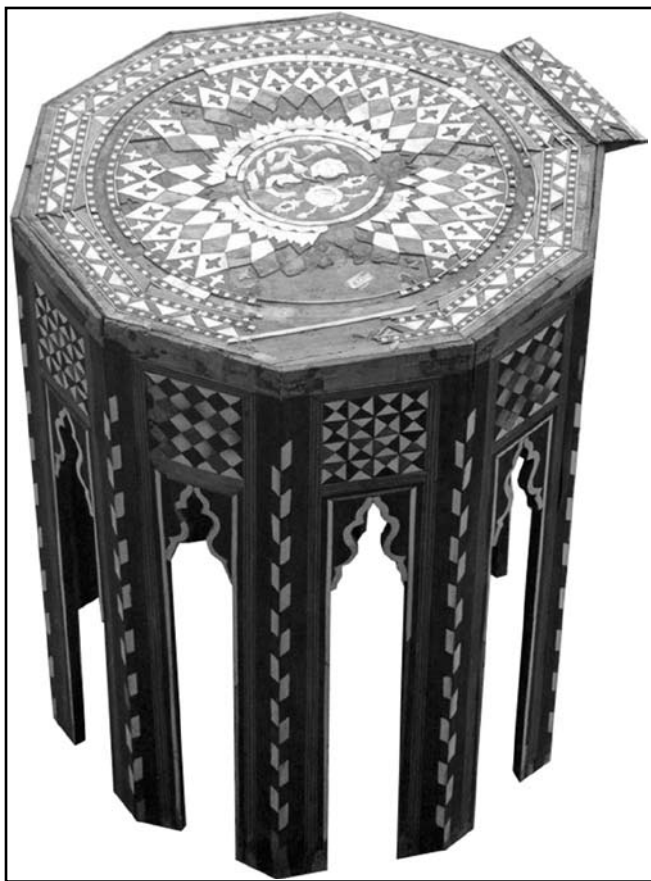
«Курсю» (вид збоку)