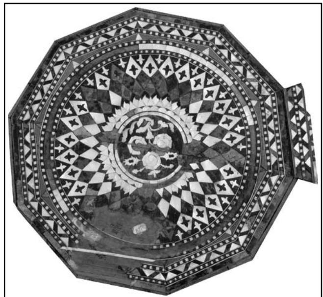
«Курсю», шестигранний столик з горіхового дерева (вид зверху; КП № 669/22)

Проте з вищезгаданих експонатів сьогодні у фондах БІКЗ, згідно опису, числяться тільки килим ручної роботи, а також столик, люстра і стіл.