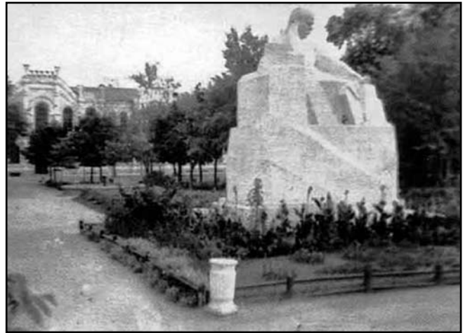
Пам'ятник Т. Шевченку в Сумах роботи І. Кавалерідзе (1926 р., знесений 1953 р.)