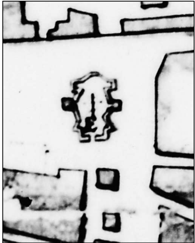
Рис. 1. Миколаївська церква на плані Глухова 1746 року

Елекція наступного гетьмана – Данила Апостола – також проходила безпосередньо під стінами та у Миколаївській церкві. Відбувалася ця подія на свято Покрови 1727 року. «А того гетьмана вибрання відправлялась церемонія таким порядком. Сентеврія 31 дня перед святом Покрови пресвятої Богородиці, в день суботній, відправлений від пана міністра Наумова офіцер з котлами і з двома сурмачами рано оголошувати указ, щоб весь народ 1 октоврія рано, як сигнал з трьох гармат учиниться, збирався в місто на елекцію гетьманську. Офіцер з оголошенням того указу їздив по всьому місту Глухову, по фільварках і по полках Козацьких, у полі стоячих, б'ючи на котлах і на сурмах віват виграваючи. І того ж дня надвечір велено всіх полків полковим осавулам зібратися в місті для прийому місць, які від церкви Святого Миколи всім полкам, де якому стояти, розміряні і кілочками означені. А на свято Покрови пресвятої Богородиці і октоврія 1, як став світ, дано сигнал з міста пострілом з трьох штук армат. І стали всі полки в чотири лави зі зброєю і пішо на вказаних місцях від церкви святого Миколи колом, повз церкву ринкову Святого Пророка Іллі. А в тому полі від західних церковних микільських дверей стояв полк гарнізонний Глухівський солдатський, а від нього шеренгою стояли полки козацькі, а, замикаючи коло, від олтарної стіни стояв полк Миргородський. А при дверях церковних північних стояли архієреї, архимандрити та інші духовні. І всередині того