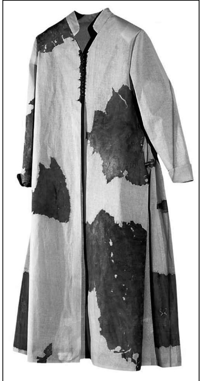
Рис. 4. Реконструкція жіночого вбрання, виявленого у похованні у Миколаївській церкві

Крім цього, у підвальній частині храму був виявлений склеп із залишками поховання. Глибина до верхньої частини склепу від сучасної поверхні становить приблизно 2–2,5 м. Вхід до місця, де виявлено склеп, знаходиться у східному куті підвалу. Він являє собою своєрідний дверний