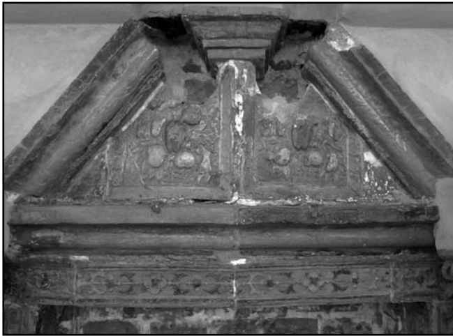
Рис. 7. Елементи кіоту, вкриті поліхромною поливою після розчистки

той факт, що під шаром піску потужністю 25–30 см, яким засипано всю віттарну частину під дерев'яною підлогою, знаходиться потужний шар деревного вугілля. Після відбудови храму керамічна підлога, вірогідно, опинилася під дерев'яним настилом.