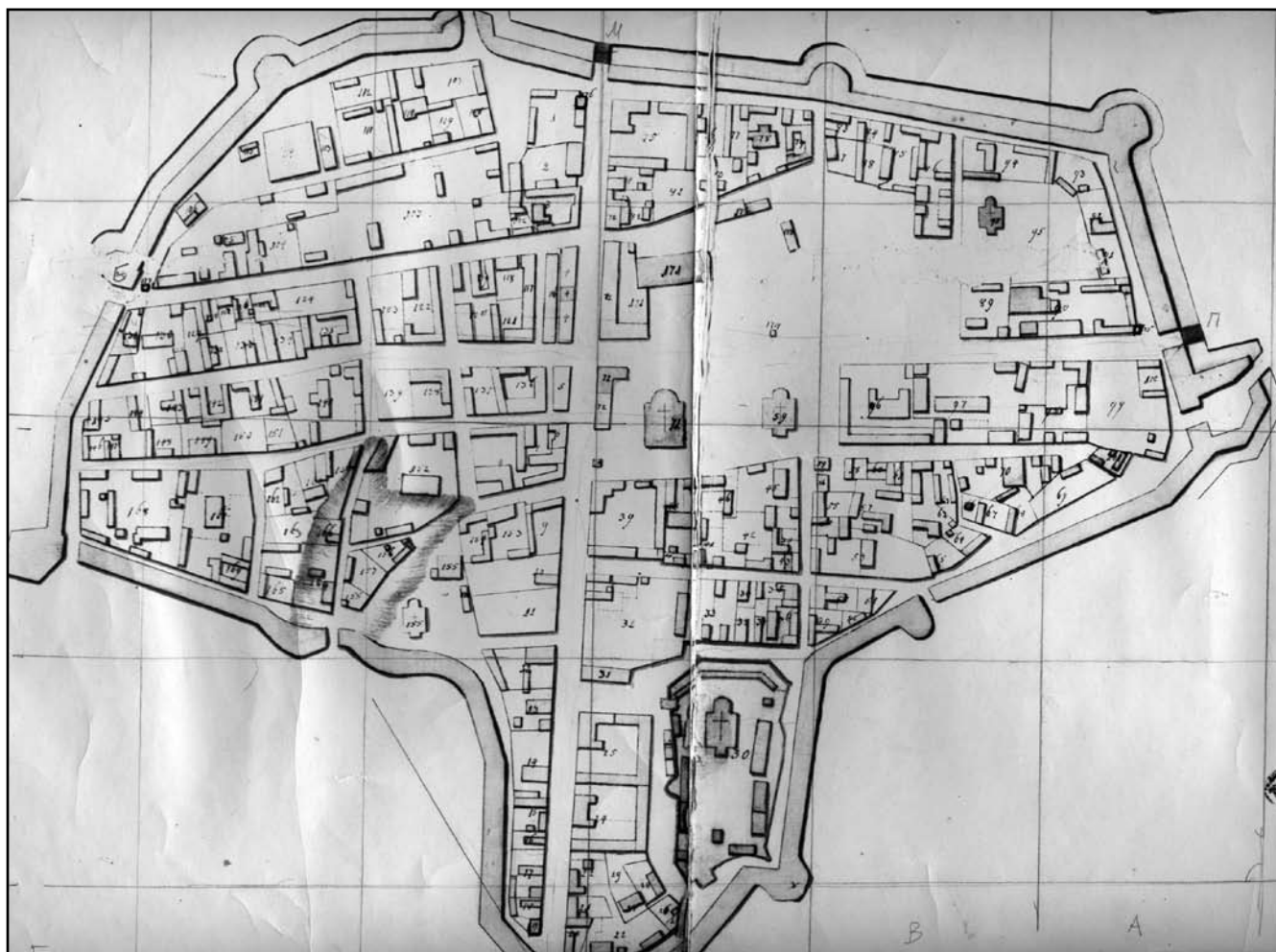
Рис. 2. План Глухова 1750 р.

килимом, гетьманські клейноди: праворуч – булаву, ліворуч – печатку, а посередині – жалувану грамоту [8, 110–122].