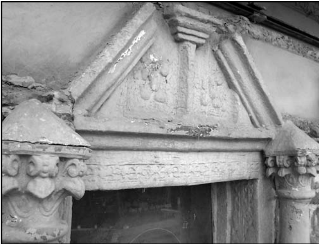
Рис. 6. Вигляд верхньої частини кіоту зі східного фасаду Миколаївської церкви до розчистки його від нашарувань олійної фарби

А.І. Чайки, кістяк міг належати жінці віком до 40 років. Під залишками зотлілих дощок та будівельним сміттям були виявлені рештки жіночої сукні (Рис. 4). Як сама тканина, так і елементи одягу є зразками дорогого імпорту, що може свідчити про поховання представниці заможної української шляхти. Поряд знаходилося ще одне поховання, без склепу, у дерев'яній труні. Воно було зруйноване при перебудові Миколаївської церкви у XIX ст. Збереглися тільки гомілкові кістки та фрагменти шкіряних жіночих чобітків. Глибина поховання від сучасної поверхні складала близько 3 м [12, 27–29]. Як відомо зі щоденника Якова Марковича, у Миколаївській церкві була похована донька гетьманши Анастасії Марківни Скоропадської від першого шлюбу з генеральним бунчужним Костянтином Голубом – Євдокія Костянтинівна – удова генерального судді Івана Чарниша. Вона померла 3 червня 1743 р. Згідно зі щоденником Я. Марковича, «для обою гроба ея купили тут атласу чорнаго и