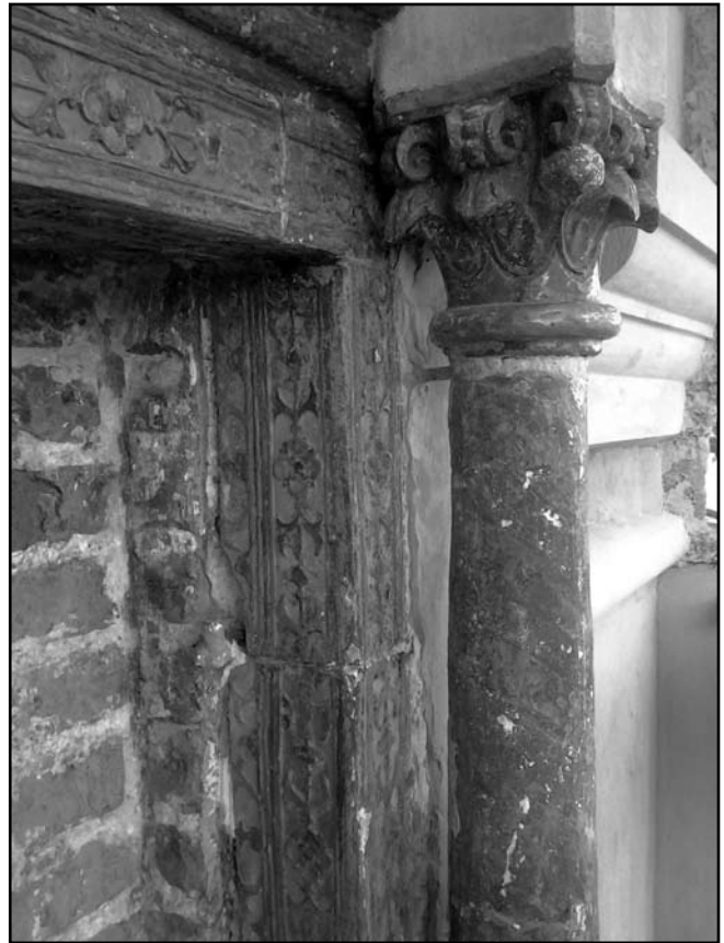
Рис. 8. Колонна та полив'яне обрамлення кіоту

Найбільшою несподіванкою у дослідженнях храму 2013 р. стало з'ясування часу улаштування ніші на східному фасаді, в якій зараз знаходиться ікона Божої Матері «Троєручиці». По периметру ніша оздоблена фігурною ліпниною, утворюючи своєрідний кіот, котрий довгий час фарбувався синьою олійною фарбою (Рис. 6). Вважалось, що кіот був зроблений з дерева або цементу під час пізніших перетворень та реконструкцій храму. При проведенні реставрації фасадів у 2013 р. були зняті тиньківка у ніші й багаторічні нашарування олійної фарби з фігурної ліпнини. Тоді ж і виявилось, що кіот конструктивно пов'язаний з цегляною кладкою при побудові кам'яної Миколаївської церкви наприкінці XVII ст., а його елементи покриті поліхромною поливою (Рис. 7). Подібні