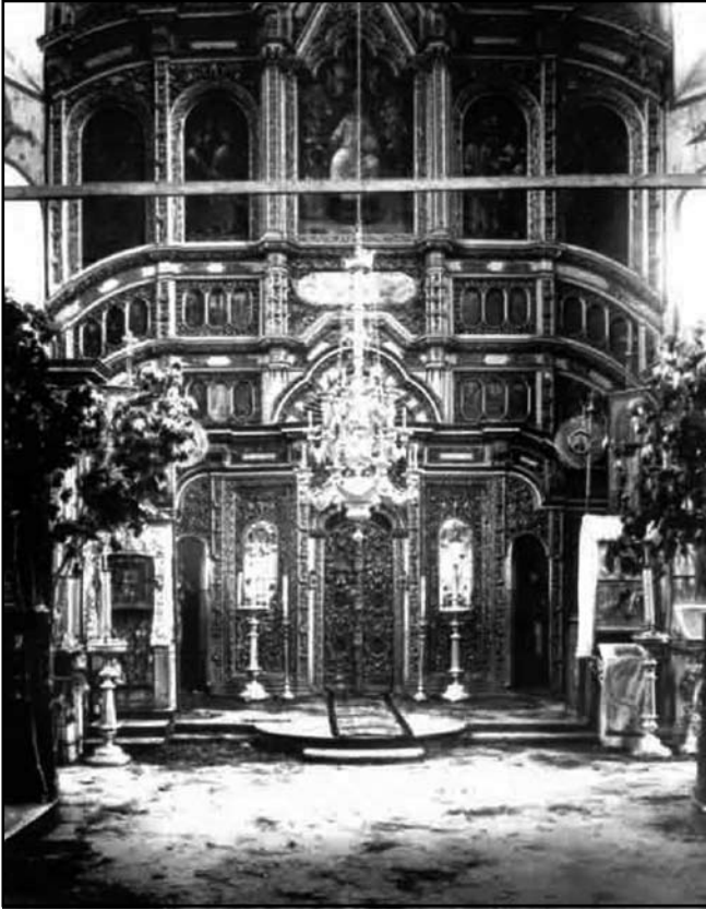
Рис. 3. Іконостас Миколаївської церкви після реконструкції 1864 р. (Світлина поч. XX ст.)