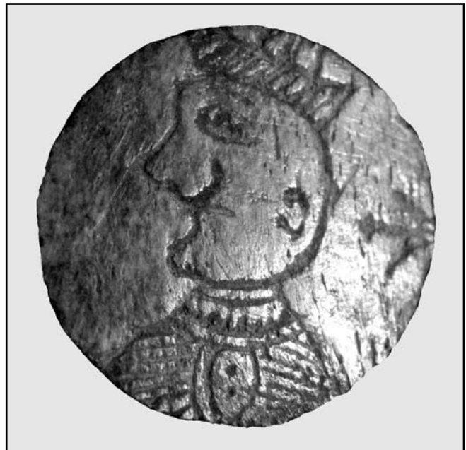
Рис. 1. Плакетка з фондів НЗ «Глухів»

Комплектування фондів являє собою як теоретичну, так і практичну діяльність музеїв, спрямовану на виявлення, збирання та наукову організацію музейних предметів, в результаті якої виникає збирання пам'яток матеріальної культури. Крім того ця робота дає можливість отримати інформацію про духовну сторону людського існування: життя різних верств населення, їх знання, вміння, звичаї, обряди, їхнє уявлення про устрій світу і місце в ньому людини. Головна мета накопичення фондів, безумовно, – документування історичної дійсності. Це означає, що через зафіксовані відомості про духовне та матеріальне життя людей в музейному зібранні повинна створюватися максимально правдива