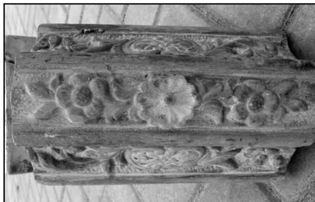
Рис. 2. Декоративний фриз з кахляної печі

У XVIII ст. на зміну цеглі-литовці приходять брускова цегла інших стандартів. У фондах заповідника