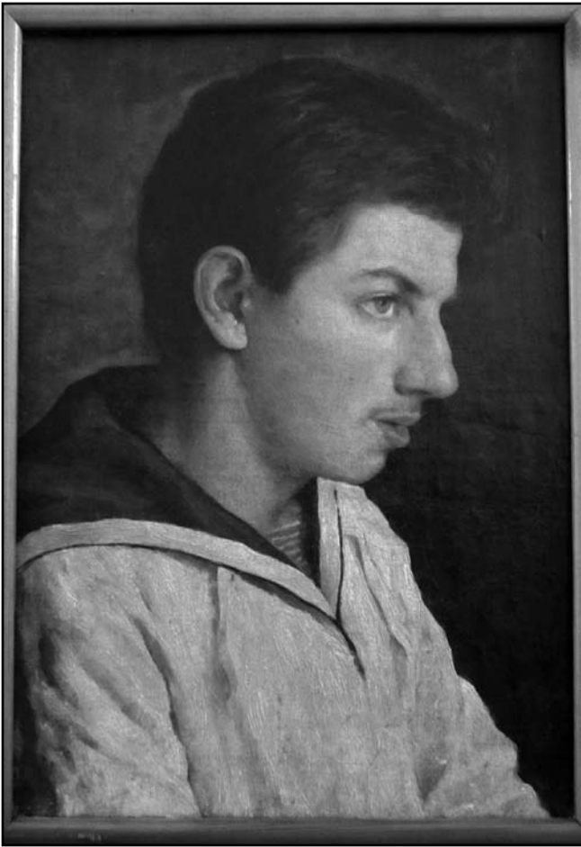
Михайло Миколайович Кочубей. Художник В.М. Соколов. Кінець 70-х – початок 80-х років XIX ст.

жилеті, білій сорочці з темною краваткою. Волосся каштанове, пряме, на косий проділ. Реставровано реставраторами ДНДРМ В.М. Ромащенко і С.І. Кумановою в 1984 р. [7].