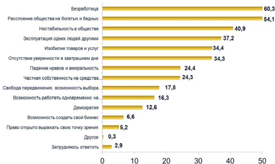
Рис. 2. Основные характеристики современного социально-экономического строя в Украине по оценкам рабочих (2013, N=1800, %)

всего 3,6% рабочих страны. В тоже время 40,4% респондентов указали, что данное явление справедливо в том случае, когда богатство получено честным путем (своим талантом, честным трудом) (табл. 4).