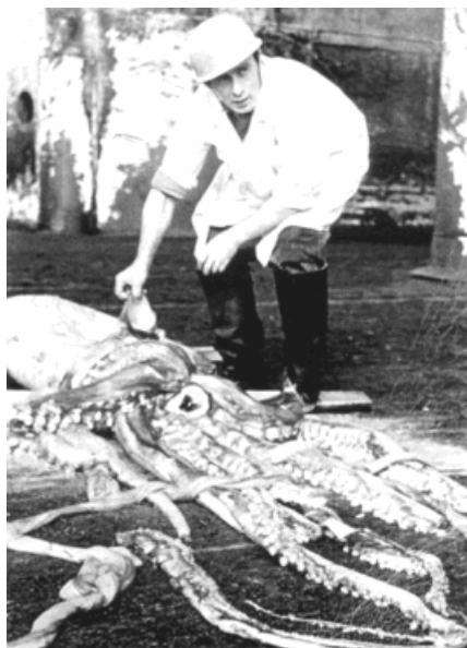
Рис. 1. Архитейтис, обнаруженный 17 апреля 1975 г. (39°00' ю.ш., 160°00' в.д.) в районе Тасманова моря, и результаты взвешиваний этого кальмара по частям (табл. 1).

Океаническое пространство Тихого океана от 140°з.д. до 90° з.д. не было нами исследовано. Сведений об архитейтисах на участке от о-вов Чатем до побережья Чили нет. Однако, скорее всего, кальмары эти здесь столь же обычны, как в Атлантике и Индийском океане. Подтверждением этому служит находка молоди архитейтиса (длина мантии 45 мм) в районе 19°51' ю.ш., 95°09' з.д. с борта японского НИС «Shou Maru» [24].