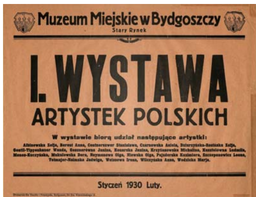
Il. 8. Afisz I. Wystawy Artystek Polskich , Muzeum Miejskie w Bydgoszczy, 1930 r. (DŹS XIV.3.2/4088.

Wernisaż I Wystawy Artystek Polskich odbył się 26 stycznia 1930 roku. Muzeum Miejskie w Bydgoszczy do udziału w tej pionierskiej ekspozycji zaprosiło kilkanaście artystek cieszących się uznaniem w kraju 11 . Były to twórczynie, które w większości zaprezentowały swoje dzieła na wspomnianej wyżej Powszechnej Wystawie Krajowej w Poznaniu [1, s. 77] 12 . Bydgoska instytucja kultury podała do wiadomości, że otwiera wielką wystawę artystek polskich . <...> Będzie okazja poznać twórczy dorobek kobiety polskiej na niwie sztuk plastycznych 13 . Ta prestiżowa wystawa dzieł polskich artystek okazała się nie tylko pierwszym tego typu przedsięwzięciem w Bydgoszczy, ale także w całej Polsce zachodniej 14 . Tak w lokalnej prasie komentowano to wspaniałe wydarzenie wystawiennicze: Kobieta z pędzlem czy z dłotem w rękę – to zawsze widok niezwykły, drażniący ciekawość, emocjonujący i frapujący. Ale cała osobna wystawa obrazów i rzeźb, których twórczyniami są wyłącznie artystki – to rzecz już więcej niż niezwykła, to żeńska Olimpiada, kobiecy wyścig, pocichu, na lekkich stopach, pośród laurowych szelestów, pod deszczem róż, tęczyowych kolorów i blasków, w obecności tysięcy wpatrzonych oczu, puls-