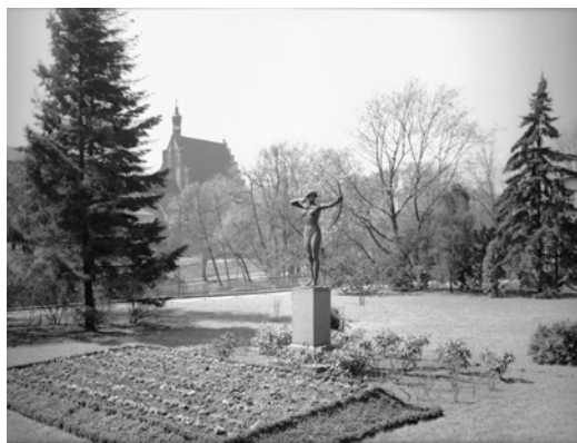
Il. 6. Widok Bydgoszczy – posąg Łuczniczki i kościół farny, 1929 r., fotografia (3/131/0/-/389). Narodowe Archiwum Cyfrowe)

Muzeum Miejskie odegrało znaczącą rolę w kreowaniu życia kulturalnego i artystycznego międzywojennej Bydgoszczy [9, s. 759-762].