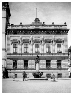
Il. 7. Budynek Muzeum Miejskiego w Bydgoszczy (obecnie nieistniejący), 1923-1939, fotografia (3/1/0/11/5).