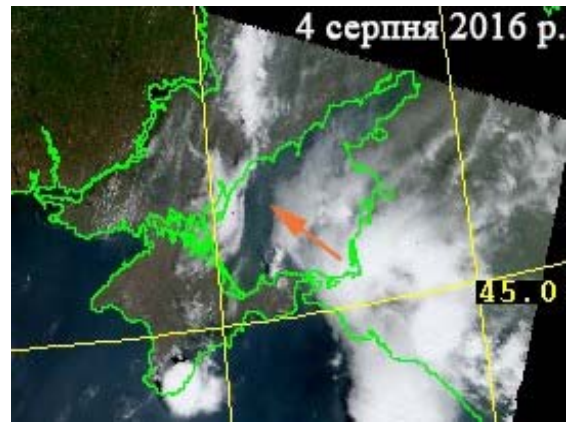
Рис. 3. Потужна аномалія хмарності (типу “каньйона”) над Азовським морем (зйомка сенсором MODIS 4 серпня 2016 року) за три доби перед землетрусом 7 серпня 2016 року

Перший етап включає виявлення ділянок сейсмічної активізації на основі просторово-часового аналізу (ПЧА) з помісячним розрізненням, а другий етап включає детальний