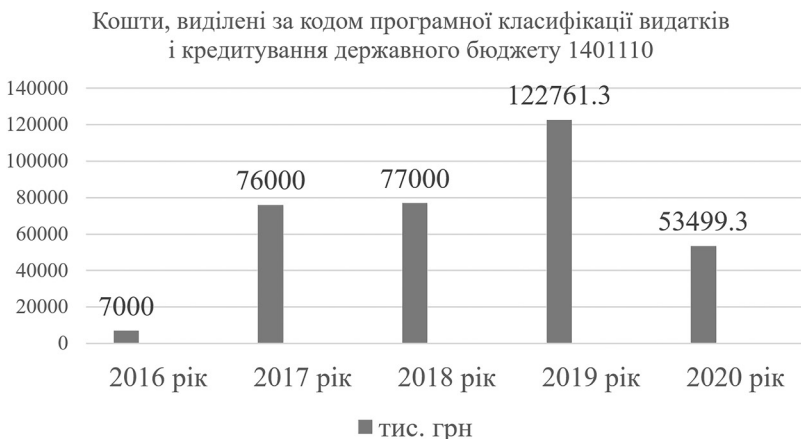
Рис. 2. Розподіл видатків Державного бюджету України на іміджеві проекти

Уклали автори на основі законів України «Про Державний бюджет України» в період 2016–2020 рр.