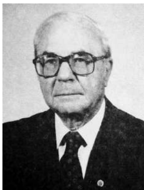
I.M. Самійленко I.M. Samilenko

Анотація. Статтю присвячено спогадам автора про відомого громадського й політичного діяча Івана Матвійовича Самійленка, останнього Голови Уряду Української Народної Республіки в екзилі, діяльність якої на чужині тривала понад 70 років. Іван Матвійович – знаний публіцист, історик і професор, був активним дослідником причин і наслідків штучного Голодомору в Україні в 1932–1933 роках, представником Державного Центру УНР в екзилі при Комісії Конгресу США з дослідження причин Голодомору, її академічним консультантом.