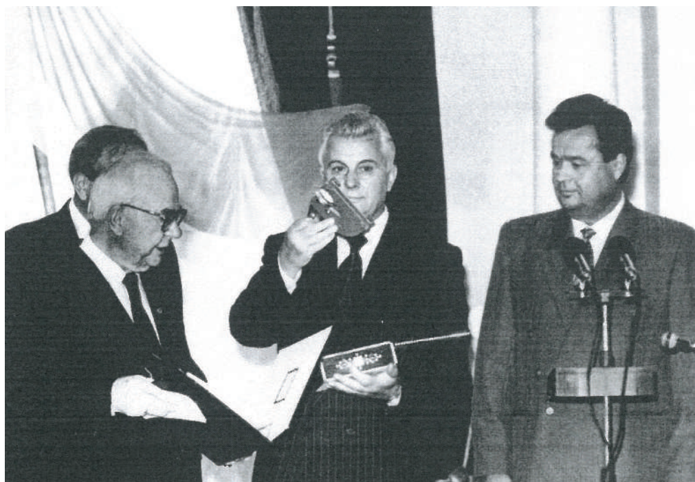
Передавання атрибутів державного екзильного Уряду УНР першому Президентові України Леоніду Кравчуку. 24 серпня 1992 року, Київ. На фото крайній зліва – І.М. Самійленко, у центрі – перший Президент України Леонід Кравчук, крайній справа – Голова Верховної Ради І.С. Плющ

А 24 серпня, в день відзначення першої річниці відновлення незалежності України (саме відновлення, а не проголошення. – авт. ) в Маріїнському палаці в Києві Л.М. Кравчук під час одержання символів і регалій УНР та її Державного Центру наголосив: «Цей акт повинен нагадати всім, що Україна веде свій родовід, свою політичну, державницьку біографію від історичних часів, які надають силу і велич нашому народові, – від часів Київської Русі, Козацько-Гетьманської держави й Української Народної Республіки».