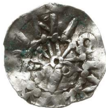
Рис. 6. Східнофризьке наслідування саксонського (?) денарія першої третини XI століття № 2.