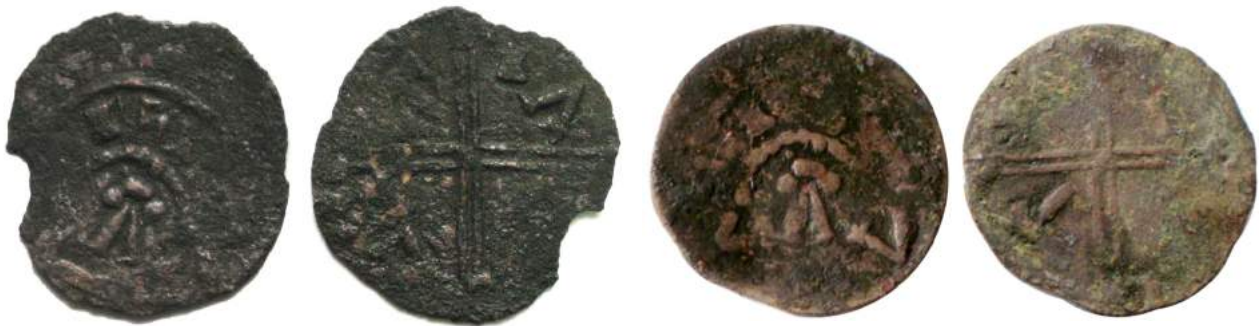
Рис. 1. Фальшивий денарій № 1.