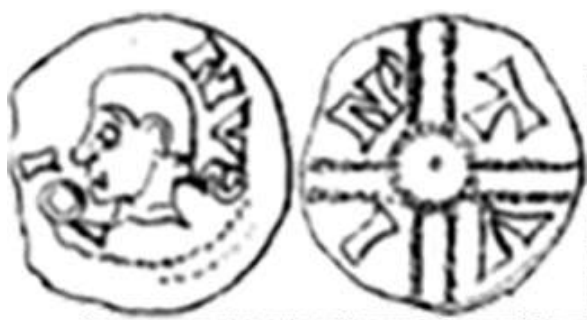
Рис. 7. Денарій міста Твін XI століття.