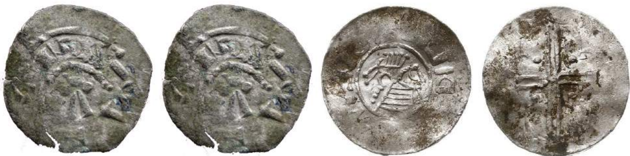
Рис. 3. Фальшивий денарій № 3.