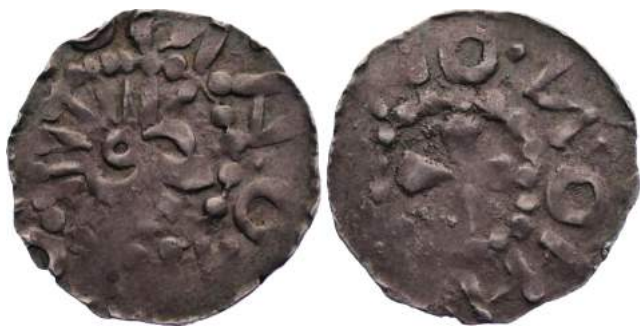
Рис. 5. Східнофризьке наслідування саксонського (?) денарія першої третини XI століття № 1.