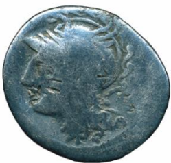
Рис. 1. Денарій Гая Целія Кальда із Луцьковлянського скарбу