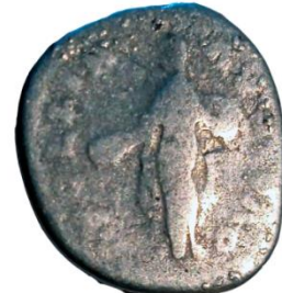
Рис. 2. Гібридне наслідування римського денарія зі скарбу с. Баченці