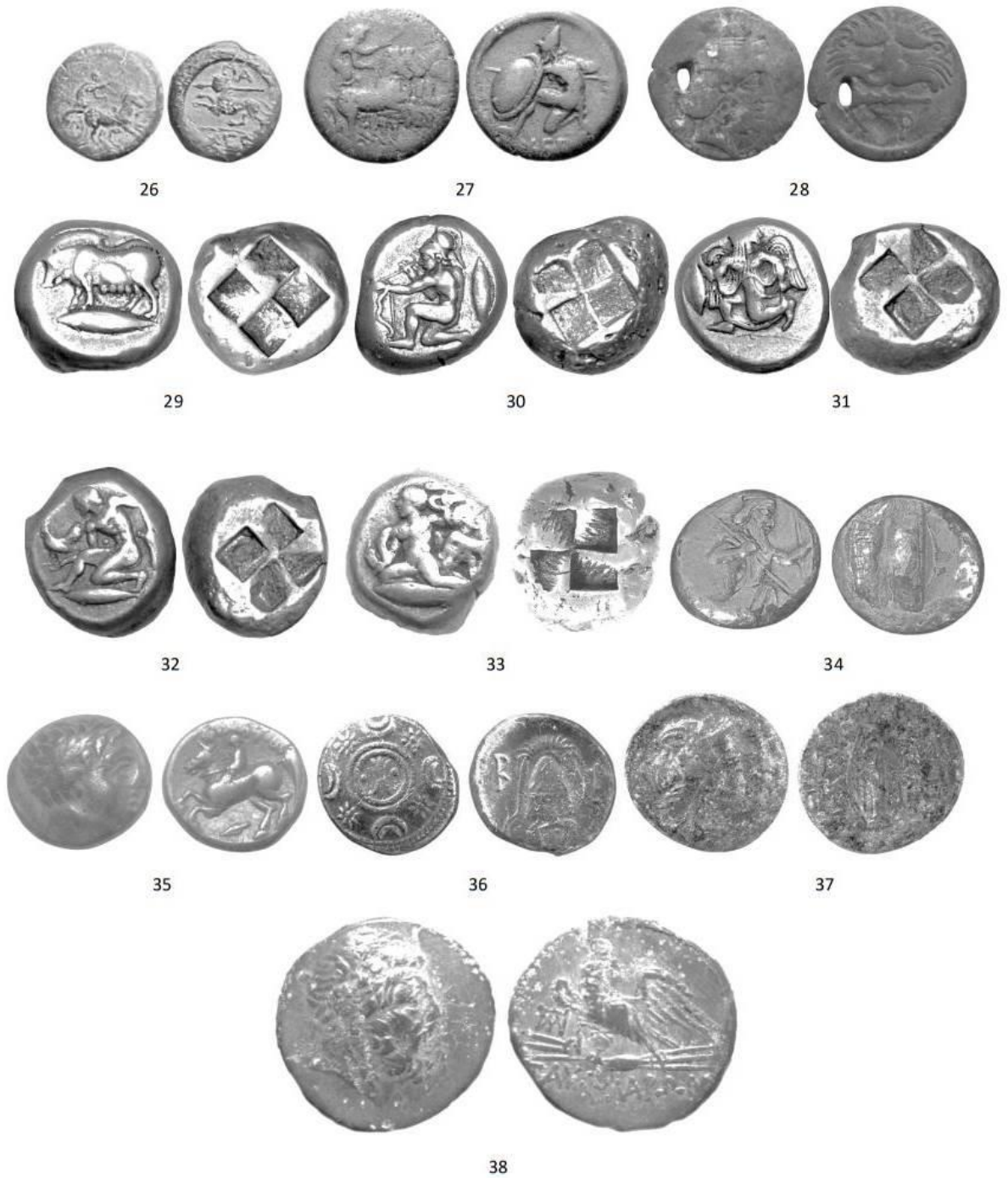
Рис.1 Монети VI-I ст. до н.е., знайдені в басейні р. Тясмин і на прилеглих територіях*