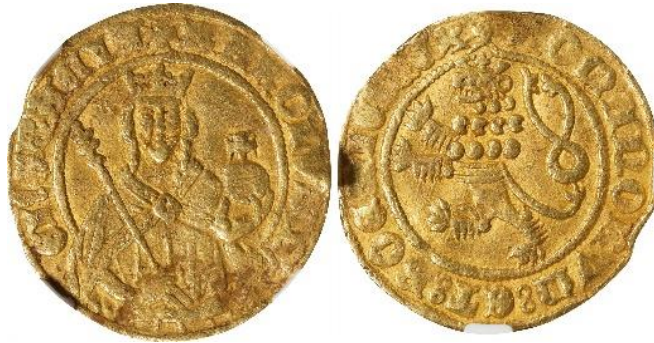
Рис. 4. Богемія, Карл I (1346–1378), голдгульден б/д, м. д. Куттенберг 52

празьких грошів, тобто традиційних празьких грошів, додатково покритих поверхневим шаром золота через намагання видати срібну монету за золоту. Але варто бути свідомими того, що можливість такої події хоча й існує та має аналоги в історії грошового обігу 51 , проте вона виглядає мало ймовірною через рідкісність богемського золотого голдгульдена.