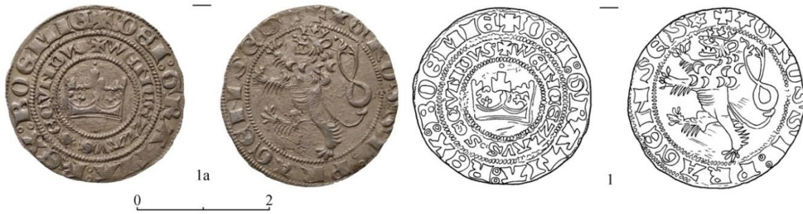
Рис. 1. Богемія, Вацлав II, грош. Вага – 3,16 г, діаметр – 2,63/2,7 мм.

Знайдено в Королівському замку Нялаб, Закарпаття