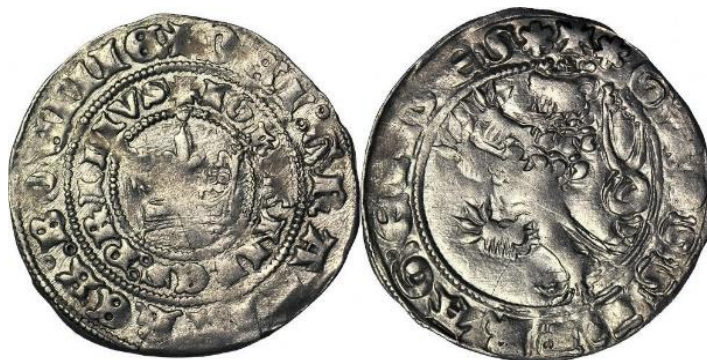
Рис. 2. Богемія, Ян I Люксембурзький (1310–1346), грош, м. д. Кутна Гора 45

За часів короля Яна I Люксембурзького карбування празьких грошів було відновлено за зразком монет Вацлава II, їх середня вага коливалась у межах 3,5–3,678 г, діаметр – 28 мм (рис. 2). Також у Кутній Горі на цю пору відновилося карбування золотої монети – флорину. Прикметно, що потрапляння золотих богемських монет на територію України дослідниками частіше розглядається в контексті обслуговування міжнародної торгівлі вищою ланкою грошового обігу – золотою монетою – цехіном, флорином, а згодом і дукатом. Вважаємо, що в дослідженні обігу празького гроша необхідно звернути більш ретельну увагу на знахідки чеських монет у комплексі із золотими європейськими монетами.