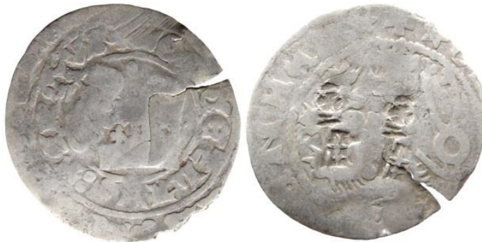
Рис. 5. Богемія, Вацлав IV, грош з подвійною контрамаркою німецького м. Зост

Монети з кількома надкарбуваннями. Навесні 2010 р. на розораному узбережжі річки поблизу с. Курники Вінницької обл. знайшли скарб празьких грошей з одним контрамаркованим примірником. До складу давнього депозиту входило 15 цілих монет та 7 уламків. Усі надані монети можна визначити як празькі гроші, карбовані в Богемії від імені короля Вацлава IV у першій половині XV ст. Серед монет та їх уламків особливий інтерес викликає гріш Вацлава IV із двома контрмарками на реверсі (рис. 5). Два надкарбування у вигляді ключа відносяться до контрмарок німецького м. Зост (нім. Soest) 144 . Такі контрамарки м. Зост використовувалися для підтвердження якості та повної ваги празьких грошей. Відомо 7 типів таких надкарбувань, які відрізняються стилем ключа.