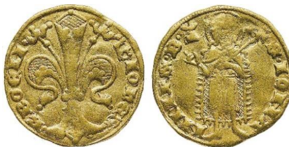
Рис. 3. Богемія, Ян I Люксембурзький (1310–1346), флорин (голдгульден),

м. д. Куттенберг. Вага – 3,5 г. 46 Легенда аверсу: IONES R BOEM