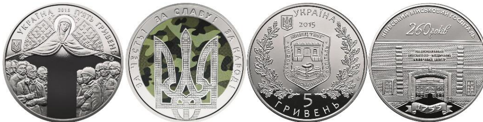
5 гривень 2015 року «День захисника України. За честь! За Славу! За Народ!»

Поранених бійців, які боронили українські кордони, лікують кращі лікарі, не стоїть осторонь і столичний військовий шпиталь, який 2015 року відзначив свій ювілей. На пам'ятній монеті номіналом 5 гривень «260 років Київському військовому госпіталю» – зображення в'їзної брами госпіталю, що розташувався свого часу на території Київської фортеці.