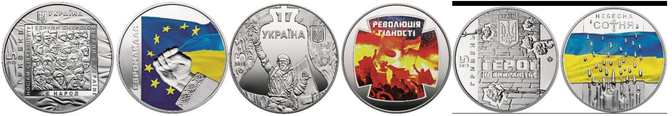
5-гривневі монети 2015 року, присвячені Революції Гідності 2014 року

Світове українство у 2015 році відзначило 1000-ліття успіху великого князя київського – Володимира Святославича. 20-гривнева монета «Київський князь Володимир Великий» нагадує світу про те, що Володимир Святий – великий князь київський та хреститель України-Руси, а не держави-агресора, яка намагається вкрати нашу історію.