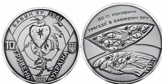
5 гривень 2021 року «80-ті роковини трагедії в Бабиному Яру»

Рік 2015 став роком ушанування пам'яті про події Революції Гідності. В обіг випускаються 5-гривневі монети: «Євромайдан», «Небесна сотня» та «Революція гідності», які, в прямому сенсі, кольорово демонструють світові прагнення українців до самоідентифікації та вивільнення від корупції.