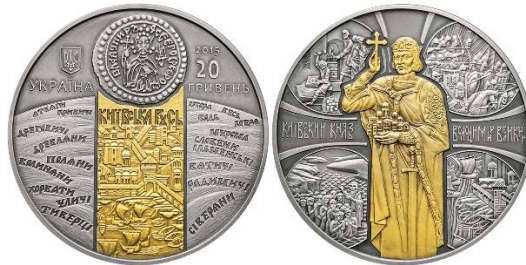
20 гривень 2015 року «Київський князь Володимир Великий»

Світове українство у 2015 році відзначило 1000-ліття успіху великого князя київського – Володимира Святославича. 20-гривнева монета «Київський князь Володимир Великий» нагадує світу про те, що Володимир Святий – великий князь київський та хреститель України-Руси, а не держави-агресора, яка намагається вкрати нашу історію.