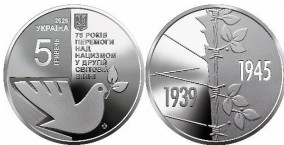
5 гривень 2020 року «75 років перемоги над нацизмом у Другій світовій війні 1939 – 1945»

Україна та українці завжди пам'ятали і пам'ятають про ціну, яку довелось заплатити нашій Вітчизні за перемогу над гітлерівцями, попри всі ідеологічні та політичні закиди російської пропаганди, звинувачення на адресу українців щодо забуття ними подвигу народів у їх боротьбі за Перемогу над нацизмом.