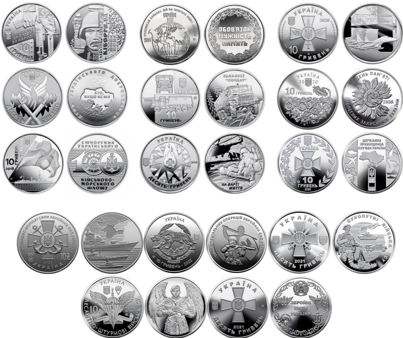
10-гривневі монети 2018 – 2022 років на честь Збройних Сил України

Військова тематика в комеморативному карбуванні України збагачується спеціальною військовою серією 10-гривневих монет, виготовлених зі сплаву на основі цинку. Перша така монета була випущена в обіг у 2017 році та присвячена «Захисникам Донецького аеропорту». У 2018 році серію продовжили монети: «День українського добровольця», «100-річчя створення Українського військово-морського флоту». Наступний 2019 рік став роком випуску монет-присвят: «На варті життя (присвячується військовим медикам)», «КраЗ-6322 «Солдат», «Учасникам бойових дій на території інших держав», «Повітряні Сили Збройних Сил України», «День пам'яті полеглих захисників України», «Державна прикордонна служба України», «Десантно-штурмові війська Збройних Сил України», «Збройні Сили України», «Сухопутні війська Збройних Сил України».