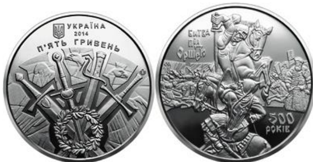
5 гривень 2014 року «500-річчя битви під Оршею»

Із початком гібридної війни росії проти України та окупації частини її території на Сході у 2014 році весь світ побачив справжнє обличчя путінського режиму. Свідома світова спільнота відразу сформувала попит на нумізматичну продукцію, присвячену військовим подіям, що результували б поразку росіян на полі бою. Першою такою монетою стали 5 гривень «500-річчя битви під Оршею» 2014 року. Перемога в Оршанській битві 1514 року зупинила наступ військ великого князя московського Василя III Івановича і мала велике міжнародне значення. Армія Великого князівства Литовського на чолі з князем Костянтином Острозьким складалася з польських, литовських, українських і білоруських військ.