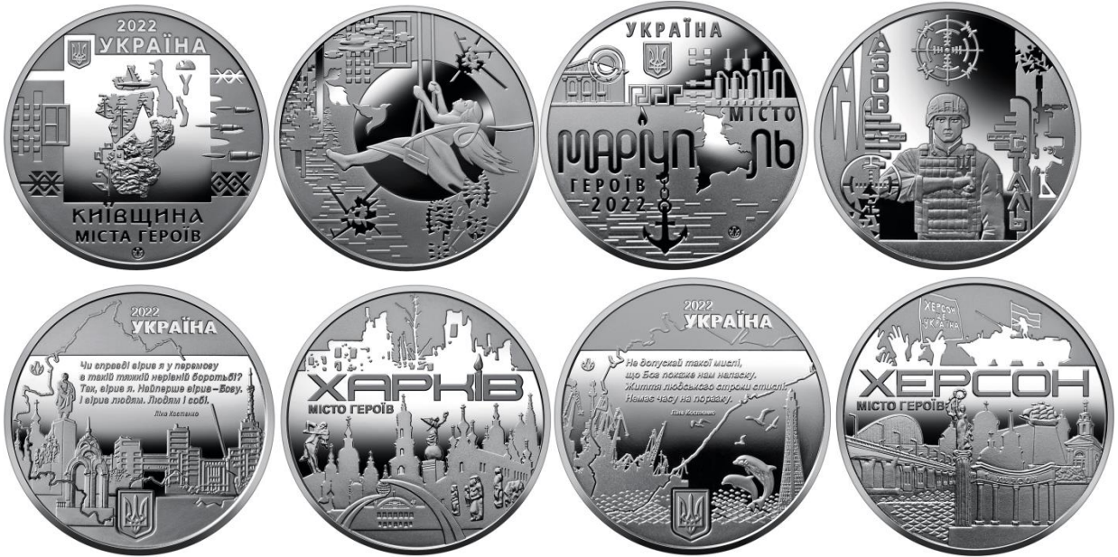
Серія пам'ятних медалей «Міста героїв»

українців на медалі нанесені життєствердуючі слова Ліни Костенко.