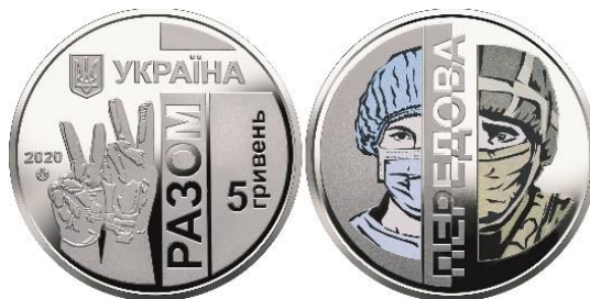
5 гривень 2020 року: «Передова»

Пам'ятною монетою року 2020 на тлі світової пандемії вірусу SARS COV-19 та продовження гібридної війни росії проти України стає монета «Передова». На реверсі 5 гривень зображено бійців військового та медичного «фронтів», які відважно борються з видимим та невидимим ворогом.