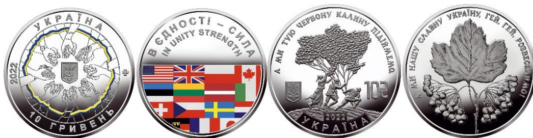
10 гривень 2022 року «В єдності – сила!»

Серія 10-гривневих монет військової тематики поповнилася випусками: «Військово-морські Сили Збройних Сил України», «Сили спеціальних операцій Збройних Сил України». Нумізматичній спільноті монети цієї серії також пропонуються у колекційному наборі з дев'яти пам'ятних монет спеціальних випусків серії «Збройні Сили України» 2018 – 2020 років.