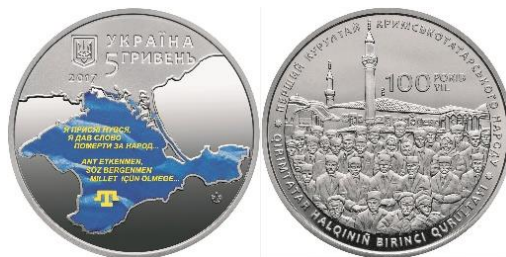
5 гривень 2017 року «100-річчя першого Курултаю кримськотатарського народу»

Політичні реалії збройної агресії росії проти України докорінно змінює тематичне спрямування ювілейних та пам'ятних монет. Окрім військової тематики набуває особливої актуальності тема злочинів радянського режиму та російського уряду проти кримських татар. Пам'ять про депортованих татар ушановується 5-гривневою та 20-гривневою монетами: «Пам'яті жертв геноциду кримськотатарського народу». 2017 року вводяться в обіг 5 гривень «100-річчя першого Курултаю кримськотатарського народу». У 2018 році кримську тематику продовжила 2-гривнева монета «100-річчя Таврійського національного університету імені В. І. Вернадського».