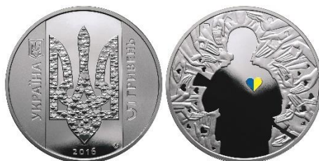
5 гривень 2016 року «Україна починається з тебе»

Успішна боротьба за державність неможлива без внеску кожного з нас. Саме про це кожному громадянину України символічно нагадує 5-гривнева монета 2016 року «Україна починається з тебе».