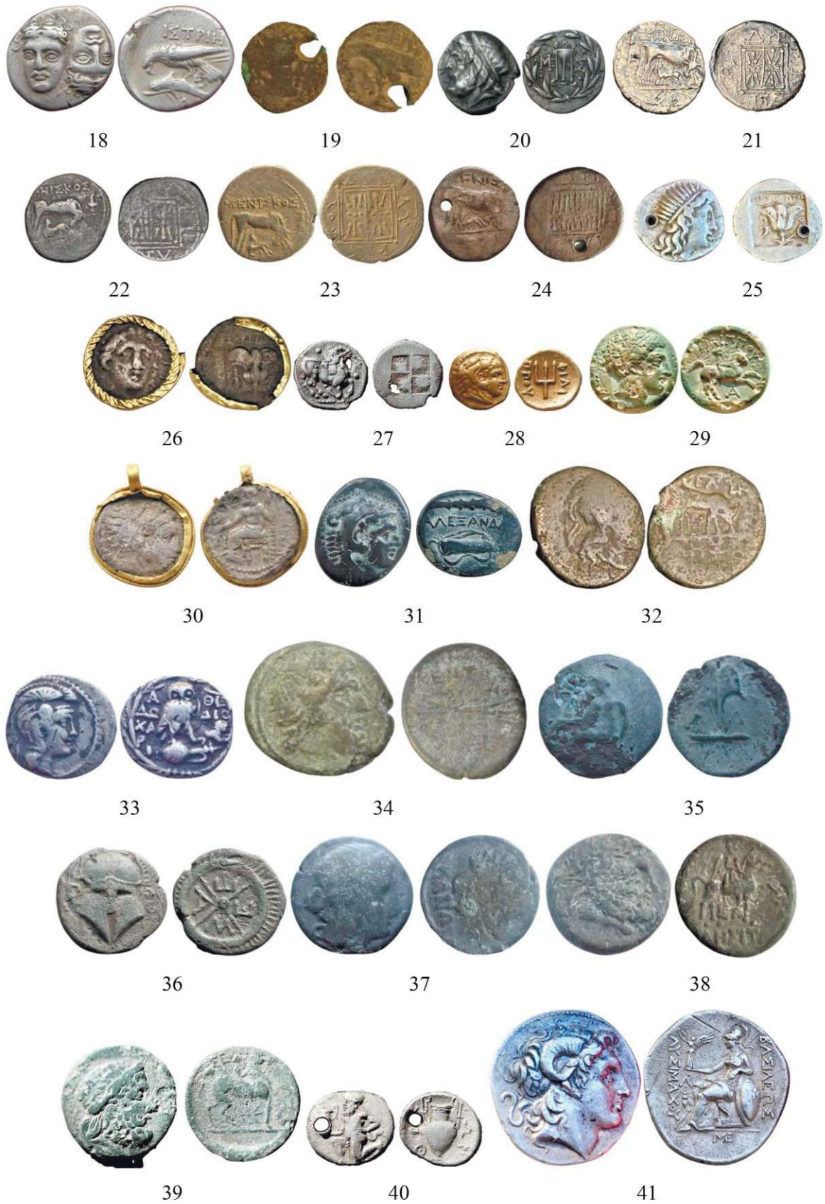
Рис. 2. Монети VI–I ст. до Р. Х., знайдені на території Поділля