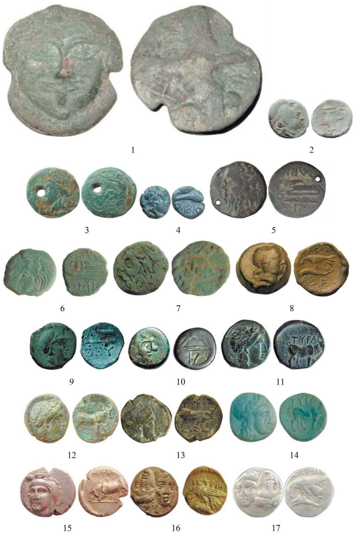
Рис. 2. Монети VI–I ст. до Р. Х., знайдені на території Поділля