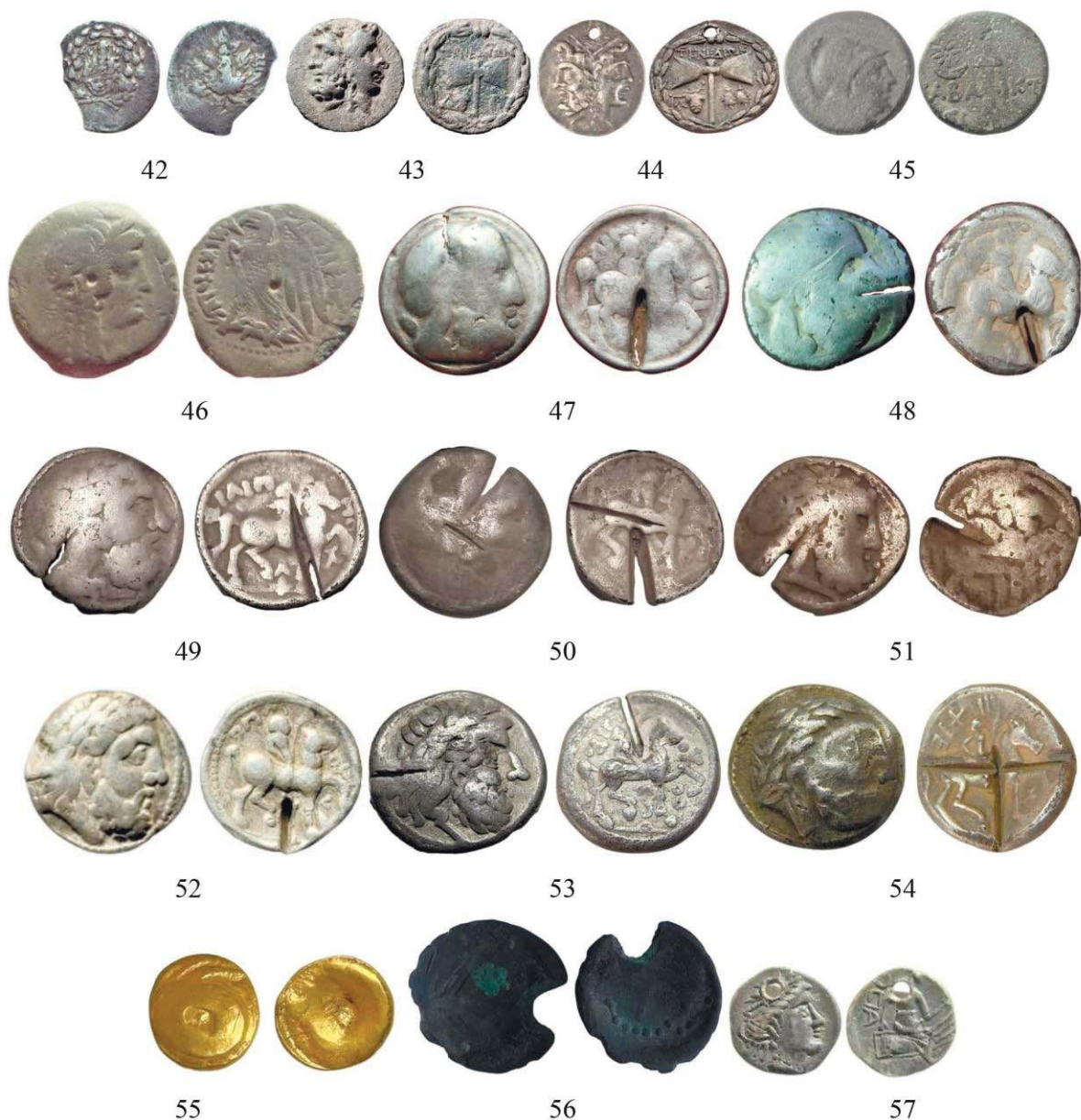
Рис. 2. Монети VI–I ст. до Р. Х., знайдені на території Поділля