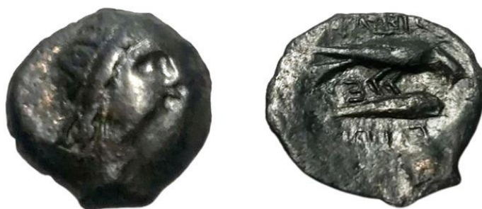
Рис. 1. Різновид складної легенди ΕΙΕΥ у варіанті ΕΙ(Ω?) та ΕΥ. Приватна колекція.

ΕΙΕΥ, ΕΥΠΡ тощо. Стосовно інтерпретації ретроградної легенди ΕΙΕΥ 51 , то ми вводимо до наукового обігу монету вказаного типу, яка має два ретроградних скорочення: над дельфіном – літери ΕΥ, а під дельфіном – літери ΕΙ(Ω?) (рис. 1). Не викликає сумнівів, що ці легенди становлять різновид легенди ΕΙΕΥ. При цьому різьбяр, імовірно, вирізавши достатньо великого розміру літери ΕΙ, додав до них ще одну літеру, очевидно Ω 52 . Вільного місця не залишилося, відповідно, майстер помістив такі, що залишилися, літери ΕΥ над дельфіном. Це свідчить, безумовно, про те, що легенда ΕΙΕΥ – аббревіатура, яка приховує два імені. Водночас відсутні будь-які підстави вважати одне з цих скорочень епонімною позначкою. Це підтверджується наявністю рівного статусу двох осіб, що приховані у легенді ΕΙΕΥ, а також нелогічністю додавати епонімну дату на один випуск при тому, що інші монети серії не мають такої дати, як ми вже довели раніше.