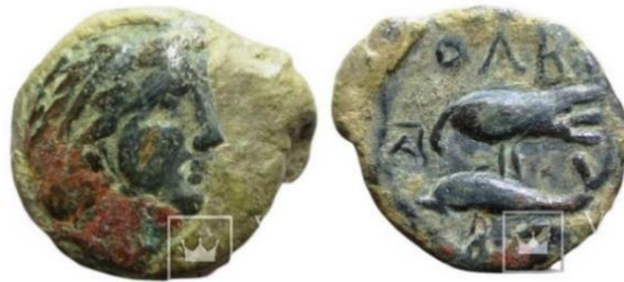
Рис. 2. Монета серії ВΣΕ з монограмою Α магістрата Пантакла Клеомбротова, який був епонімом у 195 р. до Р. Х. Приватна колекція.

Відповідно, наступний диферент № 82 на «борисфені» також розглядаємо як родове успадкування диферента № 57 та пов'язуємо його з реальною історичною особою на ім'я Παντακλῆς Λεωδάμαντος, який був епонімом Ольвії у 213 р. до Р. Х. й вихідцем із розгалуженого роду Пантаклів-Клеомбротів. Додатковим підтвердженням правильності просопографічного тлумачення цього диференту виступає його спрощений варіант – диферент № 83 100 .