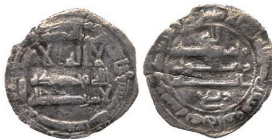
Мал. 2. Руб'а, 210 р. х., м. д. Сана'а

Ще один приклад – монета м. д. Сана'а, 210 р. х. (маса – 0,61 г, Мал. 2). Сана'а, 210 р. х. (маса – 0,61 г, Мал. 2). Знову ж таки, у полі реверсу монети, нижче стандартного символу віри, є арабське слово «руб'а» (ربع), що означає «чверть». Використовуючи відому нам масу монети, можна легко встановити, що «цілою» вважали вагу близько 2,44 г.