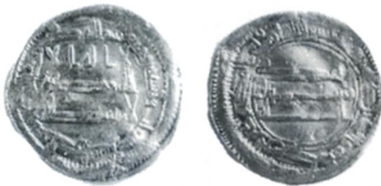
Мал. 4. Нісф, 193 р. х., м. д. Ма'дан Баджунайс

Цікавий напівдирхам або нісф, був зафіксований дослідником Арамом Варданяном у книзі, присвяченій карбуванню аббасидських монет у провінціях історичної Вірменії 9 . Він наводить нісф м. д. Ма'дан Баджунайс 193 р. х. масою 1,49 г з посиланням на аукціон 1987 р. № 57, лот № 355 аукціонного дому Спінк (Мал. 4) 10 .