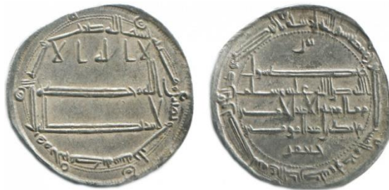
Мал. 9. Дирхам (варіант 1), м. д. Мухаммадія I, 183 р. х. 22

Наведемо для початку зображення відомих варіантів монет 183 р. х. карбування Мухаммадії I і II, а для зручності порівняння – також обговорювану монету (Мал. 9–12):