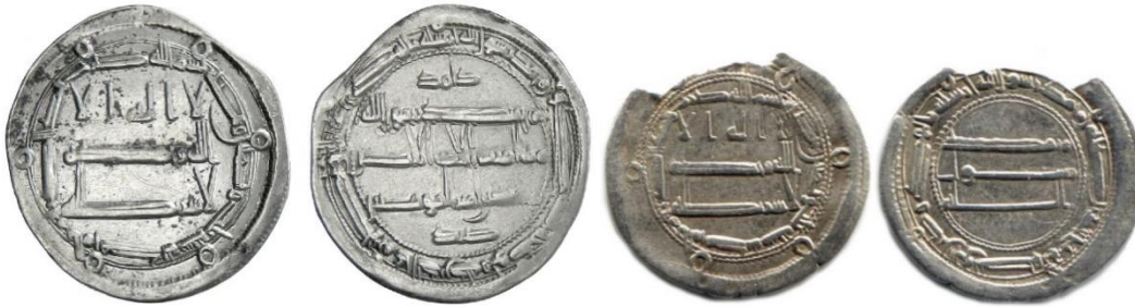
Мал. 12. Дирхам, м. д. Мухаммадія II, 183 р. х. 25 (ліворуч) і досліджувана монета (праворуч)

Можна зазначити, що обговорювана монета має на аверсі аннулети того самого типу і, найімовірніше, в тій самій кількості, що й сучасний їй дирхам м.д. Мухаммадія II (Баджунайс), а також 3-й варіант дирхама м.д. Мухаммадія I та відмінний від нього. Мухаммадія I, і відмінні від аннулетів двох інших варіантів м. д. Мухаммадія I.