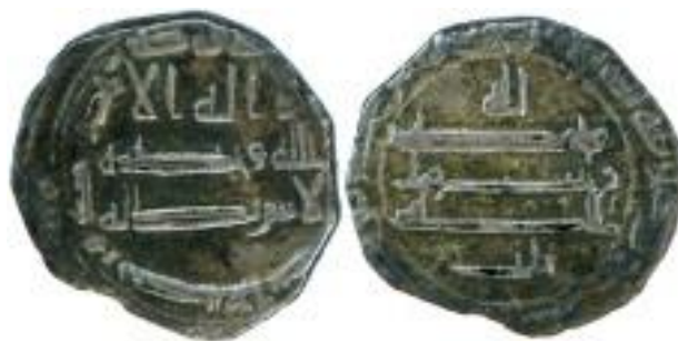
Мал. 1. Сулс, 208–209 р. х., м. д. Сана'а

подяку стародавнім монетним майстрам – вони люб'язно включили назву номіналів таких монет прямо в текст монетної легенди! Наприклад, монета м. д. Сана'а, 208/209 р. х. (маса – 0,74 г, Мал. 1). На полі реверсу монети, нижче звичайного символу віри, є арабський напис «сулс», (ثلث) що означає \frac{1}{3} . Відповідно, якщо цю монету сприймали як одну третину стандартної монети, то повний дирхам мав важити приблизно 2,25 г (можливо, більше, оскільки до нас дійшла обламана по краю монета).