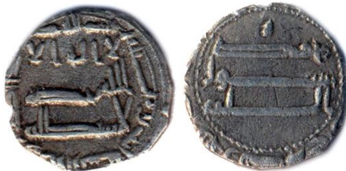
Мал. 3. Сулс, 202 р. х., м. д. Арран

Це зауваження слід врахувати, якщо звернутися до іншого прикладу монети фракційного номіналу та іншого монетного двору. Йдеться про раніше описаний та опублікований автором «сулс» м. д. Арран, 202 р. х. 5 Параметри монети були реконструйовані за методикою автора і встановлені у таких величинах: маса – 0,86 г, розмір у діаметрі – 13,6 мм (Мал. 3).