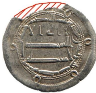
Мал. 6. Реконструкція площі монети

Далі необхідно здійснити реконструкцію первісної площі монети. У цьому випадку це зробити досить легко, оскільки облом краю зразка неглибокий, і первісна форма досить очевидна.