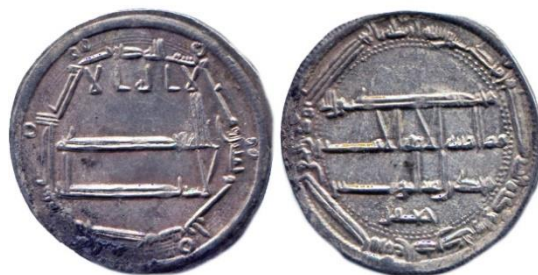
Мал. 10. Дирхам (варіант 2), м. д. Мухаммадія I, 183 р. х. 23