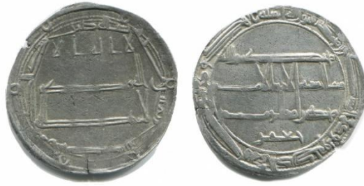
Мал. 11. Дирхам (варіант 3), м. д. Мухаммадія I, 183 р. х. 24