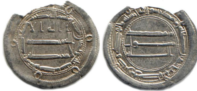
Мал. 5. Нісф, 183 р. х., м. д. Мухаммадія

Загалом, дизайн монети і репертуар написів повністю відповідають стандарту, прийнятому в ранньому Аббасидському халіфаті.