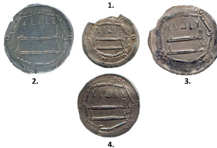
Мал. 8. Порівняння діаметра нісфа та дирхамів (в одному масштабуванні)

Така маса розглянутої монети дозволяє впевнено віднести її до половинного номіналу стандартного дирхама, тобто т. зв. «нісф». Доречним буде також порівняти діаметр обговорюваної монети з діаметрами відомих нам дирхамів цього ж року карбування інших монетних дворів халіфату: