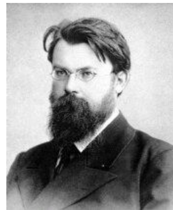
В.І. Вернадський. 1890-і роки

У 1881 р. Володимир Вернадський вступає на природниче відділення фізико-математичного факультету Петербурзького університету, де в ті часи викладала когорта видатних учених: Д.І. Менделєєв, В.В. Докучаєв, А.М. Бекетов, І.М. Сеченов, О.М. Бутлеров. Його найближчим учителем став Василь Васильович Докучаєв, який сповідував прогресивну методологію наукових досліджень: вивчав предмети і явища у їх складних взаємовідносинах, з урахуванням прямих і зворотних зв'язків між живою і неживою матерією. В. Вернадський швидко росте як науковець і громадянин. Ще у студентські роки він визначає кредо свого життя: «... Завдання людини полягає в тому, щоб приносити найактивнішу користь тим, хто її оточує» 2 .