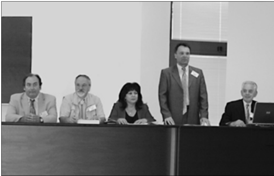
На церемонії відкриття симпозиуму

наукові досягнення, отримані у процесі виконання міжнародних проектів за програмами INTAS, CRDF, NATO.