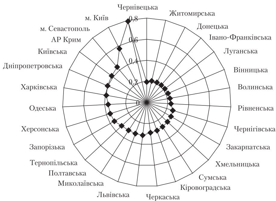
Рис. 2. Індекс освітнього рівня регіонів України, 2009 р.

Рівень освіти, як відомо, становить важливий елемент соціального капіталу. Проте він має значні регіональні відмінності. Співвідношення між мінімальним і максимальним індексом становить 1:3,4 (відповідно Луганська область і м. Київ) (рис. 2).